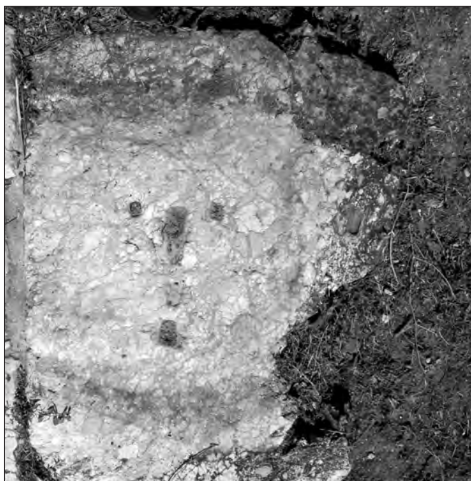
Fig. 4. Conza della Campania (Avellino), Parco Archeologico di Compsa. L'iscrizione plateale del foro: lastra 3