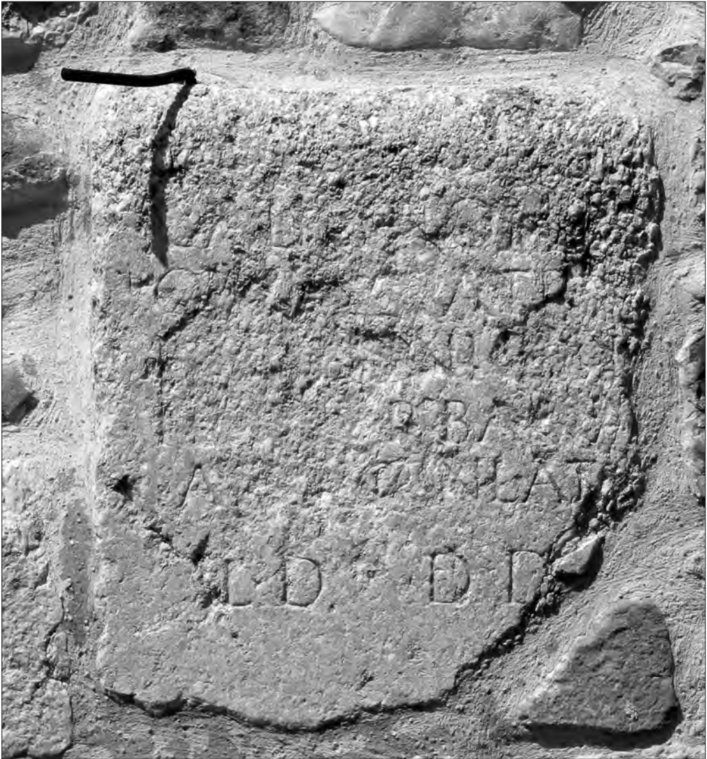
Fig. 12. Conza della Campania (Avellino), Parco Archeologico di Compsa. L'iscrizione CIL IX, 974, murata all'esterno della parete meridionale della cattedrale

spesso si distinguevano per la realizzazione a proprie spese di opere pubbliche 30 . Se la mia proposta è corretta, il secondo magistrato (del primo la lacuna impedisce