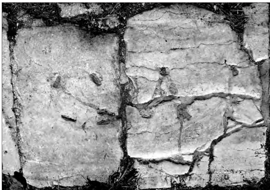
Fig. 3. Conza della Campania (Avellino), Parco Archeologico di Compsa. L'iscrizione plateale del foro: lastre 1-2