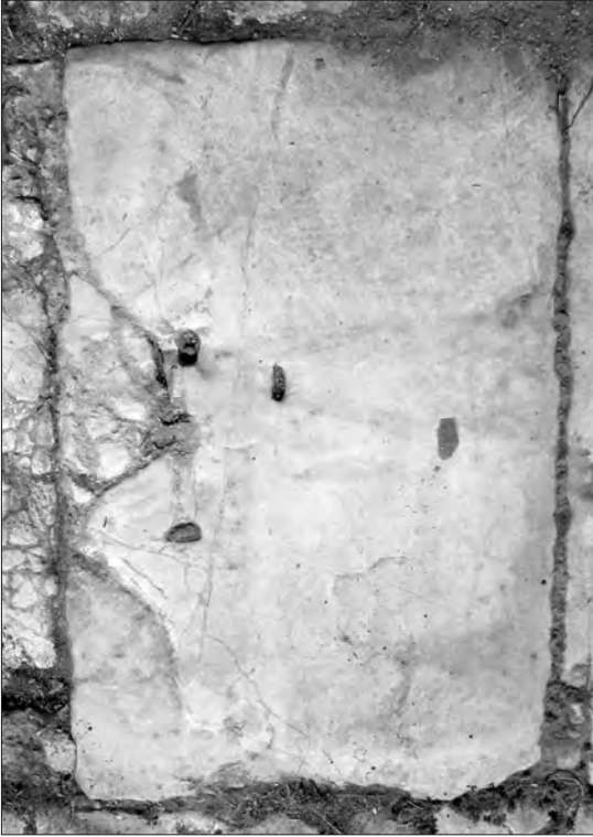
Fig. 6. Conza della Campania (Avellino), Parco Archeologico di Compsa. L'iscrizione plateale del foro: lastra 5