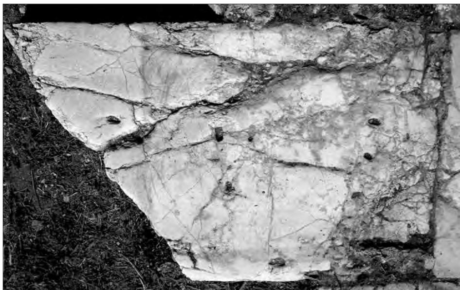
Fig. 5a. Conza della Campania (Avellino), Parco Archeologico di Compsa. L'iscrizione plateale del foro: lastra 4