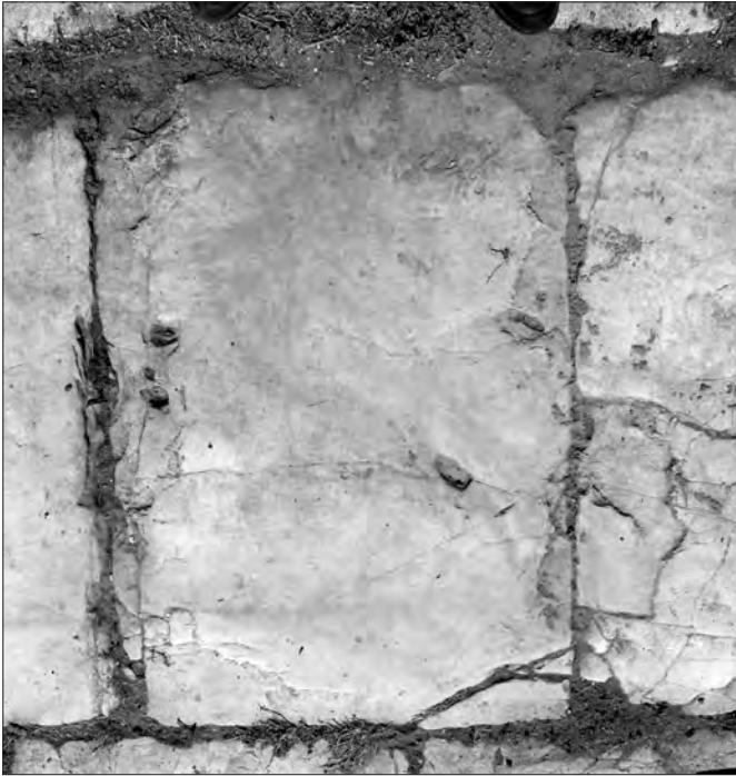
Fig. 8. Conza della Campania (Avellino), Parco Archeologico di Compsa. L'iscrizione plateale del foro: lastra 7

Lastra 5 (fig. 6). Restano tracce evanescenti del solco alveolato di una lettera e tre fori ciechi con i resti dei perni: dovrebbe essere una P. Segue poi un foro per l'inserzione di un segno d'interpunzione, di cui resta il perno.