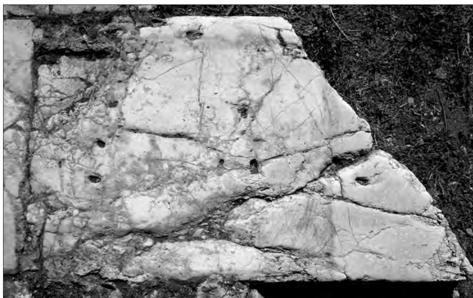
Fig. 5b. Conza della Campania (Avellino), Parco Archeologico di Compsa. L'iscrizione plateale del foro: lastra 4 rovesciata di 180°