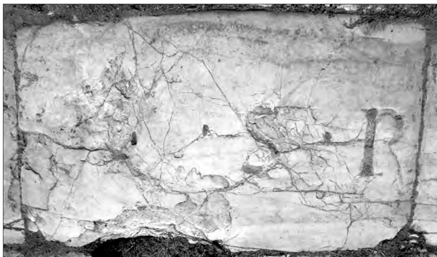
Fig. 9. Conza della Campania (Avellino), Parco Archeologico di Compsa. L'iscrizione plateale del foro: lastra 8