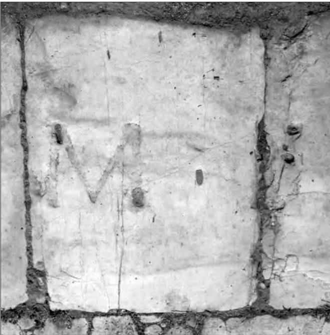
Fig. 7. Conza della Campania (Avellino), Parco Archeologico di Compsa. L'iscrizione plateale del foro: lastra 6