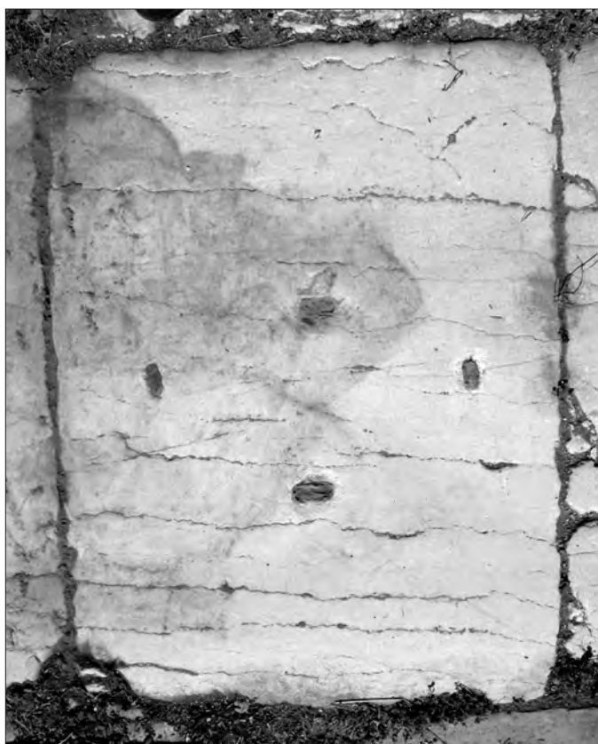
Fig. 10. Conza della Campania (Avellino), Parco Archeologico di Compsa. L'iscrizione plateale del foro: lastra 9