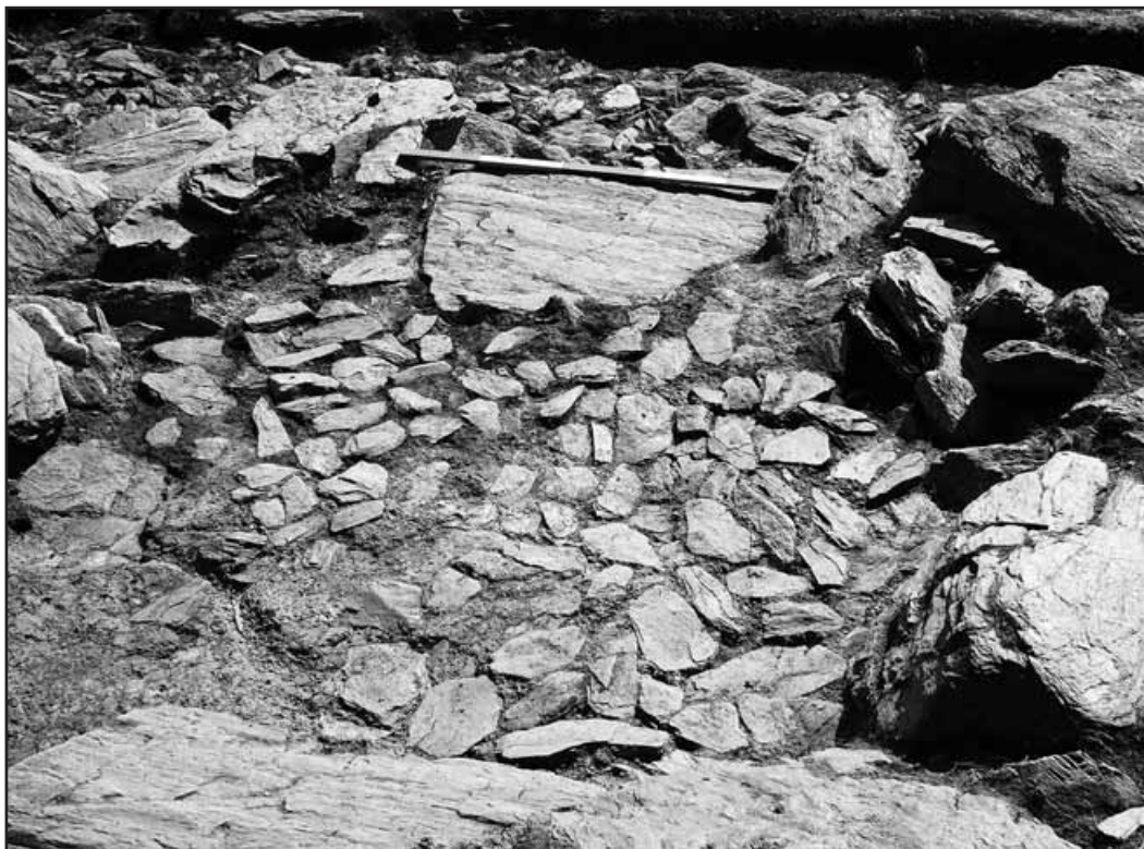
Forn d'enriquiment de mineral de ferro. La remodelació de la part frontal del túmul megalític al llarg dels segles entorn del canvi d'era propicià la creació de manera continuada de tota una sèrie de forns oberts, que presentaven una planta pseudocircular i uns murs de protecció d'alçada limitada, destinats al tractament inicial del mineral de ferro.

Aquesta situació es concreta en un coneixement molt limitat dels Pirineus abans del procés de feudalització. A tall d'exemple, a la part de la comarca del Pallars Sobirà al nord de Sort (més del 60% de la seva extensió) l'any 2000 només es coneixia un jaciment amb una clara cronologia prehistòrica. 4 A la resta de la comarca el panorama no canviava gaire, amb tres monuments megalítics enregistrats, coneguts des dels inicis del s. xx, 5 dos jaciments enregistrats fruit d'intervencions immobiliàries (la Granja Parramon, a Peramea, i Santa Eulària, a Sort). Tan sols dos jaciments d'època anterior a l'Edat Mitjana, la Cabana de Perauba, a Peracalç (Clop i Faura, 1995), i el Dolmen de la Font dels Coms (Gassiot et al., e.p.a., e.p.b.) a Baiasca, Llavorsí, han estat objecte d'intervencions arqueològiques sistemàtiques en els darrers 50 anys.