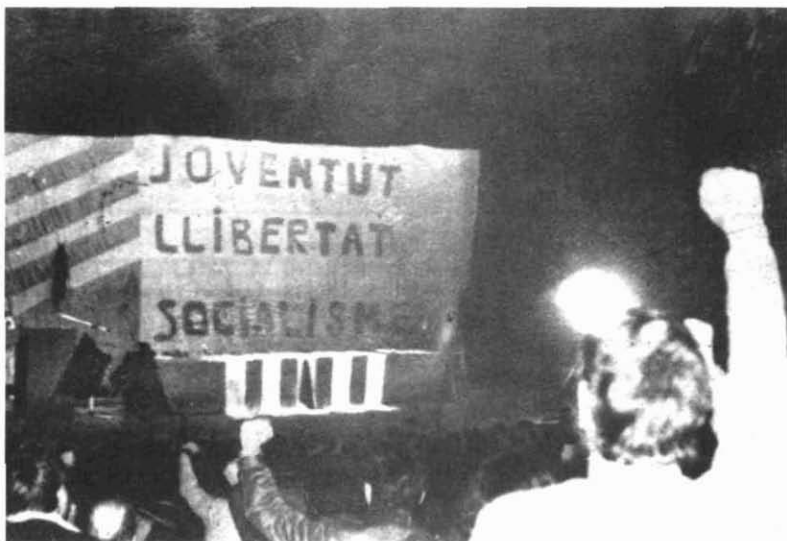
Fotografia 1. Miting per a la joventut, la llibertat i el socialisme celebrat a Sabadell el 28 de gener de 1977.

sinistros funcionarios de la BPS no cesan en sus persecuciones, y la JC junto con el Partido es uno de sus principales objetivos."