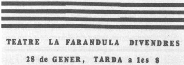
Figura 2. Cartell anunciador del míting, 28 de gener de 1977.

donen informació de les fonts de finançament: balls, venda, propaganda, festes, col·lectes entre militants del PSUC i simpatitzants.