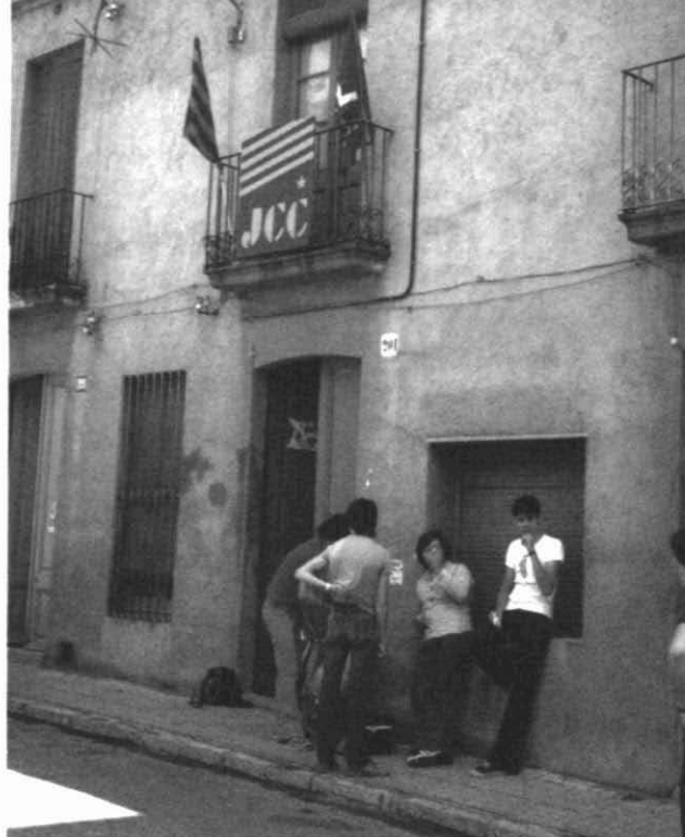
Fotografia 2. Seu de les JCC, La Flama, situada al carrer de Sant Pau, 201 de Sabadell, ca. 1977.

Les crítiques a CCOO són similars, tot i que s'aconsegueix crear la secretaria de joves de CCOO. Es deuen més de 50.000 pessetes i es decideix deixar el lloguer del local la Flama al carrer de les Paus. De tota manera, encara es conserva una certa capacitat de convocatòria, com ho demostren els 300 joves que participen en un ball al Col·legi Isabel de Castella on es van aconseguir 35.000 pessetes. En aquesta tessitura, segurament, el més dur va ser l'enfrontament amb els feixistes locals en el conflicte obert per l'ocupació del Casal Pere Quart al qual ens referirem més tard, però des del punt de vista intern la visió no podia ser més amarga: