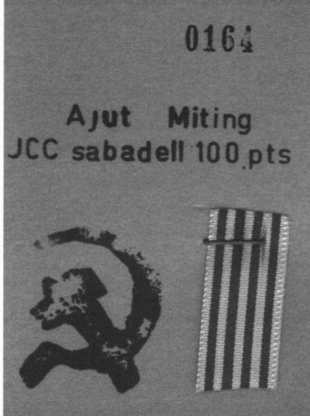
Figura 1. Bo d'ajut del míting organitzat per la Joventut Comunista de Catalunya, 28 de gener de 1977.