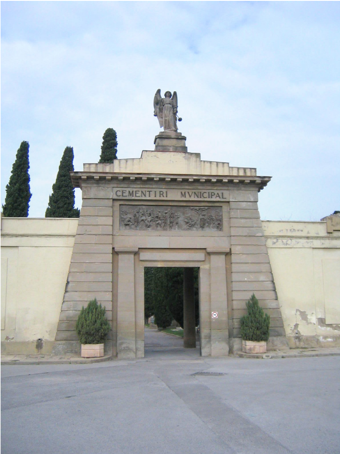
Fotografia 4. Portalada del cementiri de Manresa.