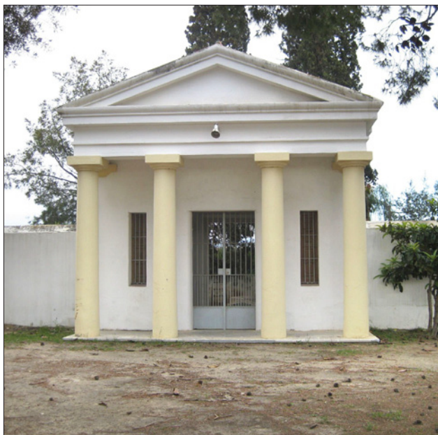
Fotografia 12. Cementiri de Vilanova i la Geltrú: entrada a la zona destinada a enterraments no catòlics.