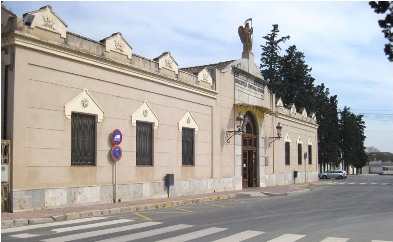
Fotografia 5. Façana principal del cementiri de Reus, amb les infraestructures auxiliars de la sala d'autòpsies i la casa per a l'encarregat.

les dependències estan situades a banda i banda de la monumental façana neoclàssica, formant pavellons amb obertures de mig punt. Al de Vilanova i la Geltrú, inaugurat el 1817, aquestes estances estan situades a banda i banda del pòrtic d'accés al recinte –una estructura construïda el 1855–; sobre les llindes de les portes hi ha uns esgrafiats on es llegeix “Custode” i “Depósito”. També trobem aquesta disposició a Olot: uns simples cossos a banda i banda del pòrtic d'accés, amb porta de mig punt i teulada de dues aigües. El de Tarragona té dos pavellons que flanquegen l'entrada. El de Sant Andreu de Palomar, inaugurat el 1839, manté aquestes instal·lacions situades a banda i banda de l'interior del pòrtic d'entrada, un vistós element neoclàssic. Al de Granollers hi ha dos cossos de planta rectangular col·locats simètricament, emmarcant la portalada de ferro que dóna accés al cementiri; aquestes instal·lacions són de planta baixa amb coberta, de teules planes, a dues vessants, i les seves façanes estucades