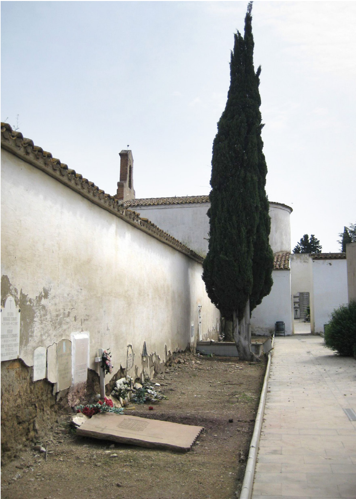
Fotografia 10. Cementiri de Lleida: zona destinada a enterraments no catòlics.