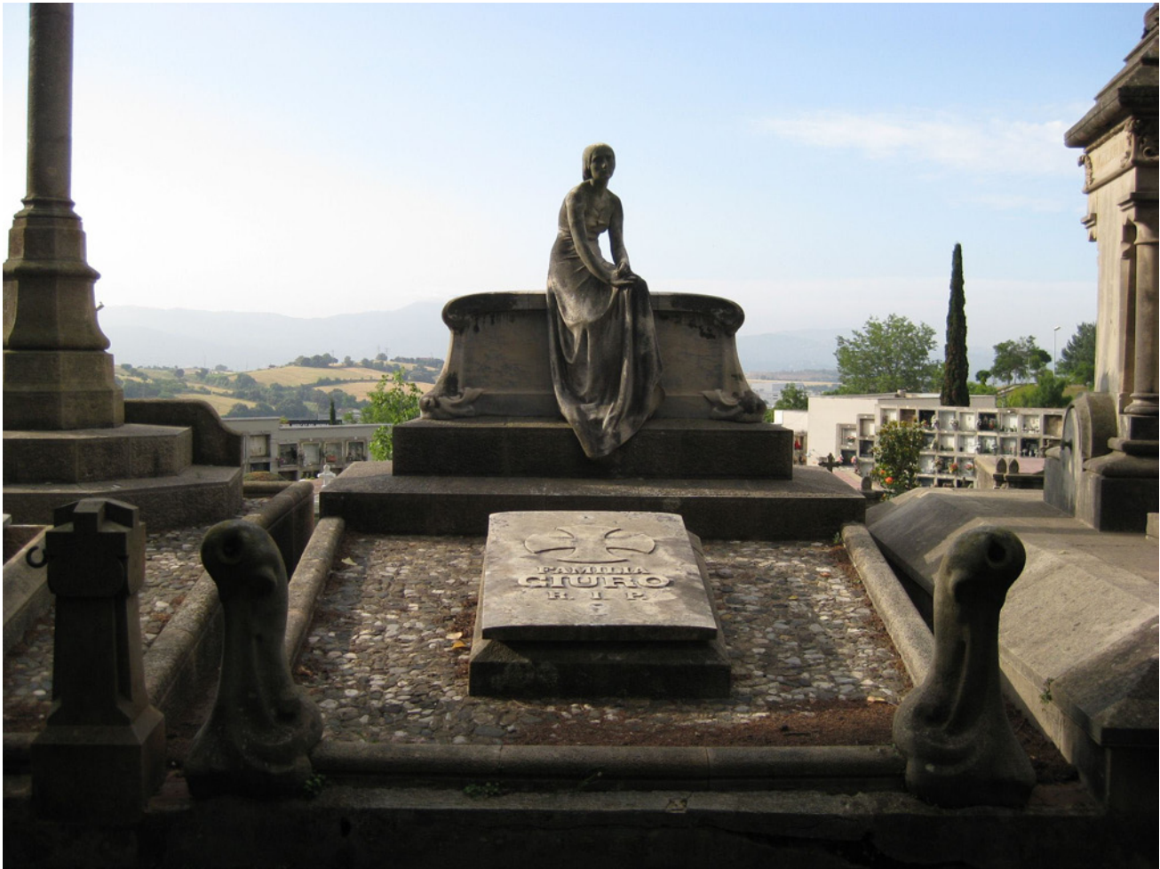
Fotografia 2. Vista panoràmica des del cementiri de Granollers.