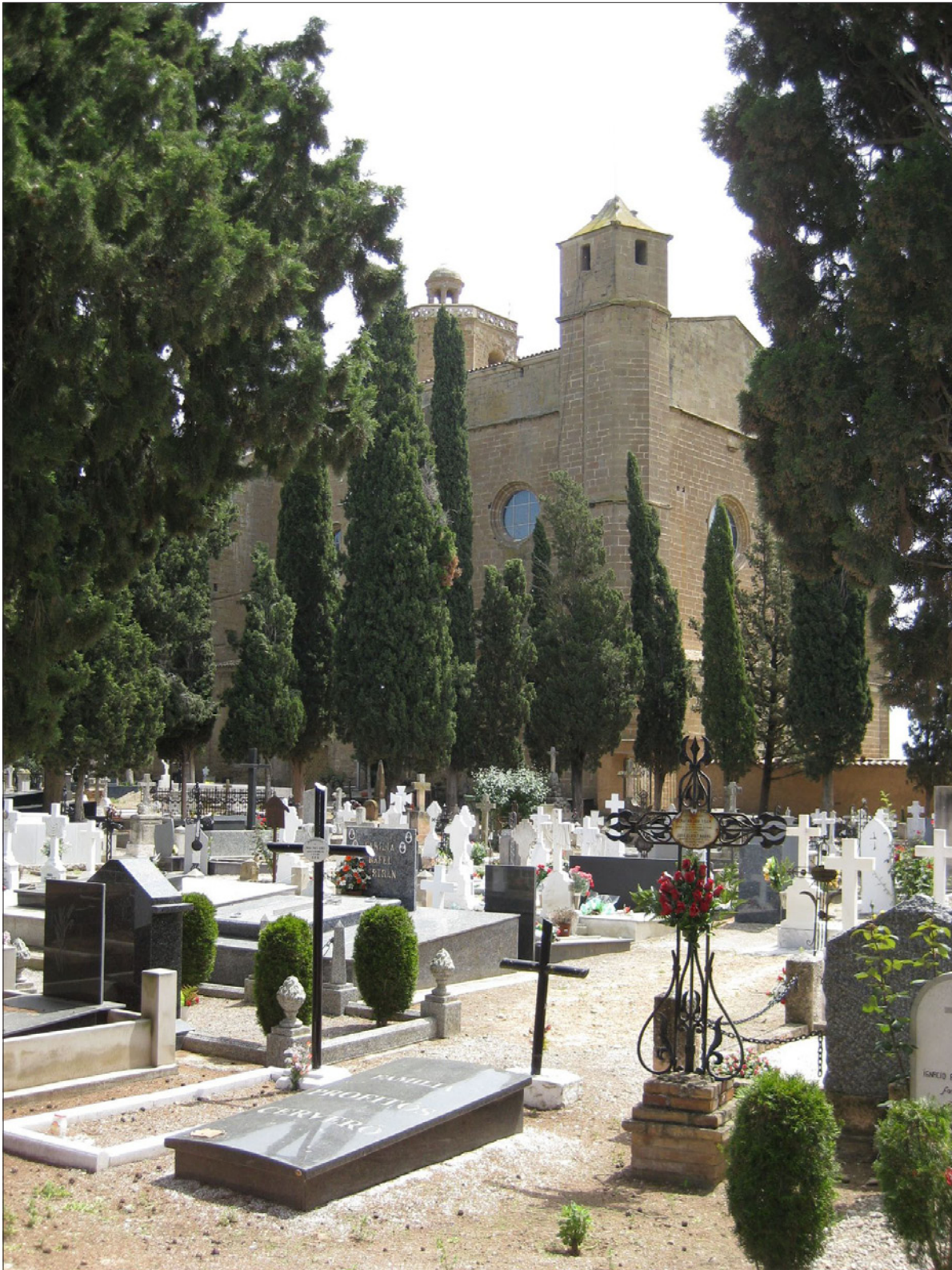
Fotografia 1. Vista general del cementiri de Balaguer, amb la col·legiata de Santa Maria al fons.