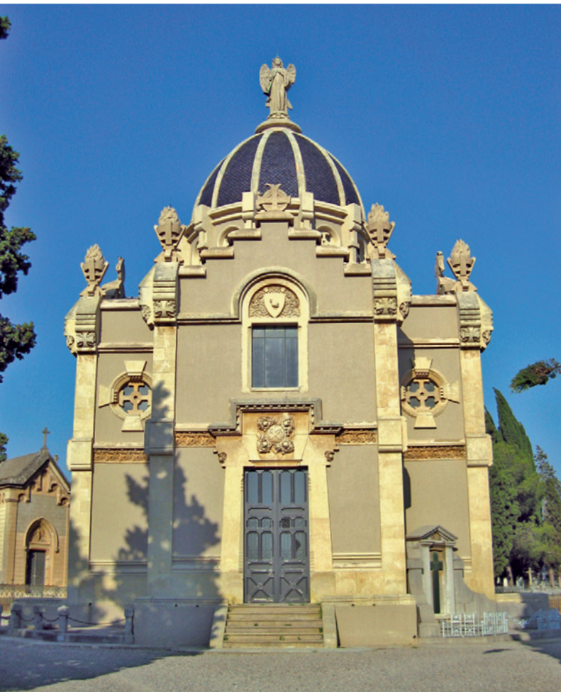
Fotografia 6. Capella del cementiri de Sabadell.

La capella de Sant Nicolau, construïda per l'arquitecte Miquel Pascual i Tintorer l'any 1880 i restaurada el 1973 per l'arquitecte Félix de Azúa, és de planta de creu grega inscrita en un octògon i cúpula escatada coronada per un àngel de la resurrecció. Aquest edifici domina el centre geomètric del recinte i té una estètica molt eclèctica, amb influències de l'estil secessionista. La seva centralització forma part d'un plantejament o tipologia urbanística catalogada com un senyal de modernitat o condició de cementiri contemporani propi del segle XIX i que, al contrari d'altres cementiris catalans, al de Sabadell encara es manté. Aquesta centralització té,