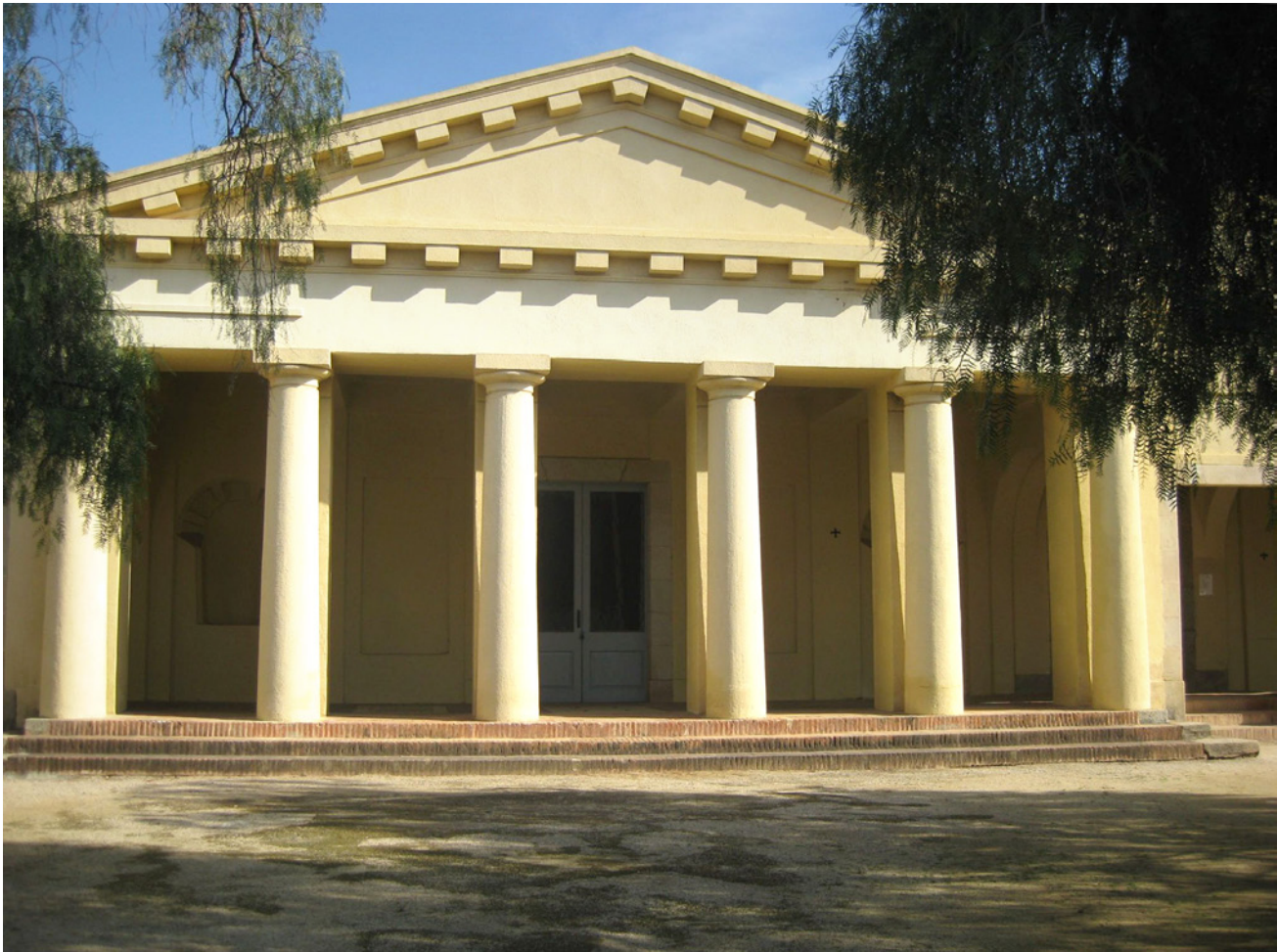
Fotografia 7. Capella del cementiri de Mataró.

A partir de 1883, s'establí que cada municipi disposés d'un cementiri neutral per inhumar-hi tots aquells que morissin fora de la fe catòlica i que, quan això no fos possible, per manca de recursos, s'hi destinés un espai tancat per un mur i unit al cementiri considerat catòlic. 14 Amb aquesta disposició s'intentava reconciliar els conflictes sorgits entre particulars i l'autoritat eclesiàstica facilitant un enterrament digne a tothom, fos quina fos la religió que professés cada difunt. Respecte a aquest tema, l'evidència d'una part dedicada a cementiri civil solament la conserven de manera plena cinc cementiris dels comparats, i parcialment, catorze. 15 El cementiri de Sant Nicolau