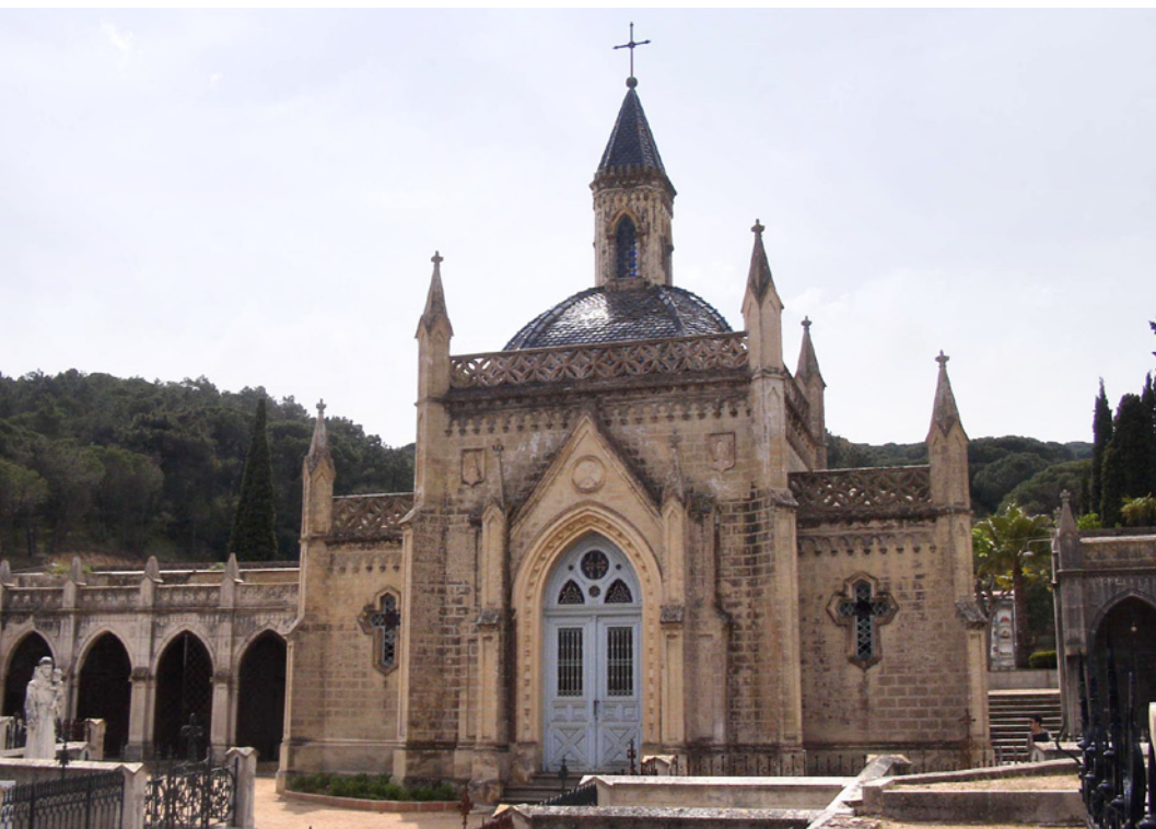
Fotografia 8. Capella del cementiri de Sant Feliu de Guíxols.