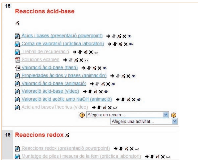
Figura 5. Detall d'un tema de l'aula virtual de química. A la imatge es poden veure diferents eines d'edició accessibles únicament per al professor editor del curs.

Amb l'objectiu de potenciar l'autonomia de l'alumnat i de fomentar el treball col·laboratiu, al llarg dels darrers dos cursos l'autor ha realitzat a classe algunes activitats basades en l'estratègia de la cacera del tresor. Bàsicament es tracta de plantejar a l'alumnat una sèrie de preguntes, tot facilitant una llista d'enllaços en els quals poden buscar una part de les respostes. Al final s'inclou una gran qüestió que