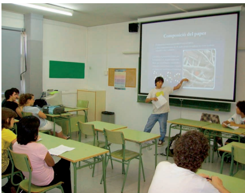
Figura 6. Un grup d'alumnes del primer curs del batxillerat exposa els resultats del seu treball davant els companys de classe amb el suport de la pissarra digital.

El «wiki» es va mostrar com una eina molt adient per a l'elaboració col·laborativa dels treballs. Cada grup d'alumnes pot disposar d'un «wiki» habilitat pel professor a la mateixa aula virtual de química. Tots els components de cada grup poden introduir les seves aportacions, que queden emmagatzemades. També poden consultar i, si escau, modificar les aportacions dels seus companys, de manera que el treball es va millorant progressivament