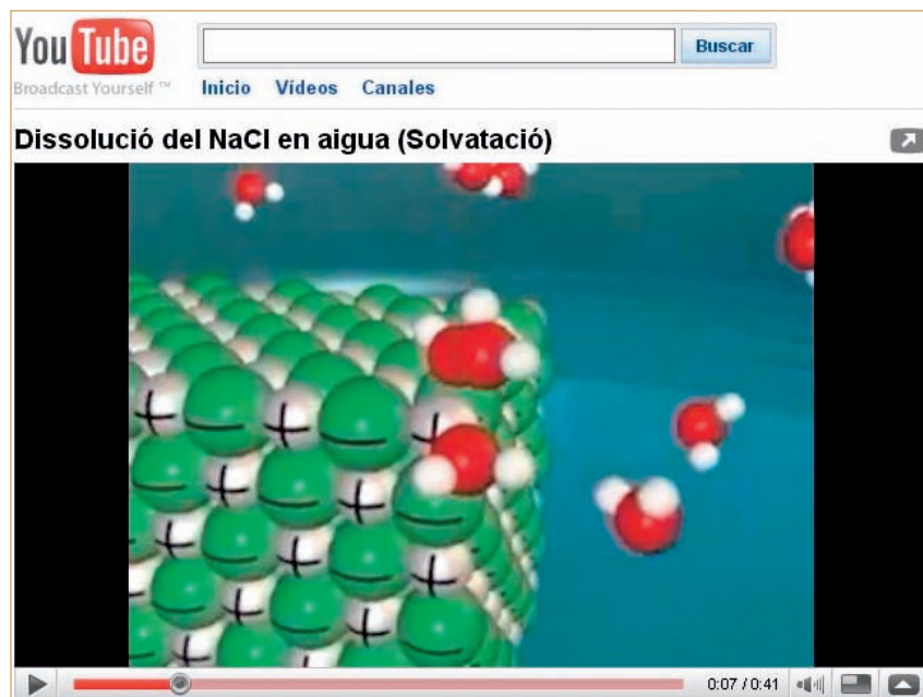
Figura 2. Al portal YouTube es pot trobar un gran nombre de vídeos i d'animacions molt útils per explicar els conceptes clau de la química. A la imatge es pot veure una de les animacions enllaçades a l'aula virtual de química.

L'aula virtual de química conté apartats específics dedicats a la formulació i a la nomenclatura