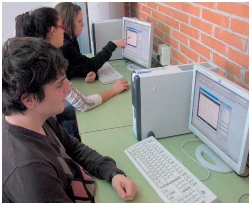
Figura 7. Alumnes de batxillerat treballant amb recursos digitals a l'aula de ciències.