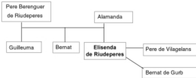
Família d'Elisenda de Riudeperes: 1230 (1ª referència) – 1287 (testament)

Pel que fa a Elisenda de Riudeperes, senyora del nostre capbreu, sabem que és filla del cavaller Pere Berenguer de Riudeperes i neboda de Ponç de Riudeperes 22 . Va estar casada 23 en primeres núpcies amb en Pere de Vilagelans i posteriorment amb en Bernat de Gurb. Tenim constància documental de l'existència d'Elisenda entre 1230 24 i 1287, 25 a més d'un document de 1242 en què apareix com a muller de Pere de Vilagelans. 26