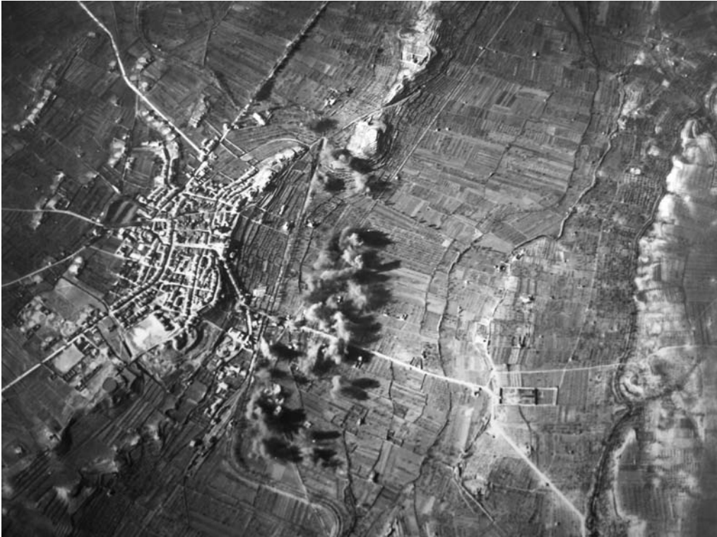
Bombardeig a les Borges Blanques, 2 de desembre de 1938.

Blanques, on establí l'Estat Major, en un edifici situat al passeig Terrall, núm. 14 (Cal Paco) 9 . Posteriorment Líster i les seves tropes es desplaçaren cap a la zona de Tarrés. Hi hagué 10 o 12 dies d'autèntica lluita i d'esforç titànic, uns per defensar una línia d'entrada a Catalunya i altres per destruir clarament els focus de resistència que cada vegada eren més dèbils. Només cal revisar els "partes" de guerra d'un i altre bàndol 10 . A tot això els bombardeigs franquistes ja havien fet la seva feina. Tot i que entre el 20 de desembre i el 7 de gener hi hagué bombardeigs constants a gairebé tots els pobles de la comarca, anteriorment aquests, ja havien fet estralls a diferents pobles de les Garrigues, bàsicament a la població civil, que provocaren la fugida en massa de bona part d'aquests habitants cap a refugis fora del nucli de la població per evitar perdre la vida. Així, molts s'establiren als camps, refugiats en cabanes, allunyats dels objectius de l'aviació.