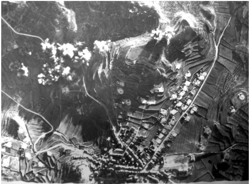
Bombardeig a Castellldans, 3 de gener de 1939.

gons el “parte” oficial de guerra de l'exèrcit republicà: “A las 13 horas cinco Heinkel-111 bombardearon el pueblo de las Borjas Blancas ocasionando más de sesenta víctimas entre la población civil...” 24 .