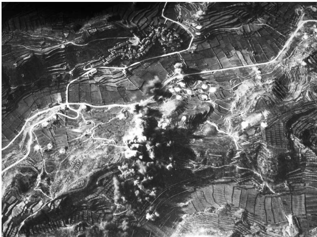
Bombardeig a El Soleràs, 25 de desembre de 1938.

ocasions; les Borges Blanques amb 11; Cogul i l'Albagés amb 5; La Granadella i Arbeca amb 3; Juneda, Granyena, Vinaixa i Omellons amb 2 i amb un atac, les poblacions del Soleràs, el Vilosell i Fullella. Un total de 12 poblacions de les 25 que conformaven la comarca aleshores. Per tant, gairebé la meitat.