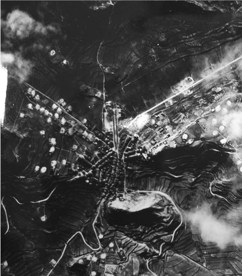
Bombardeig a Castellans, 31 de desembre de 1938.

culpabilitat, per tant se'ns fa difícil establir o quantificar la part d'implicació de l'aviació alemanya, italiana o franquista.