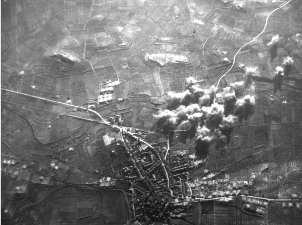
Bombardeig a Juneda, 25 de desembre de 1938.

1938, un al poble del Vilosell 14 i l'altre, a la Granadella 15 .