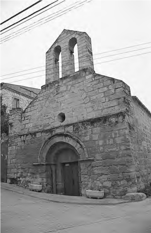
Església romànica de Sant Pere de Maldà

del patrimoni s'ha de tractar des de tres punts de vista: