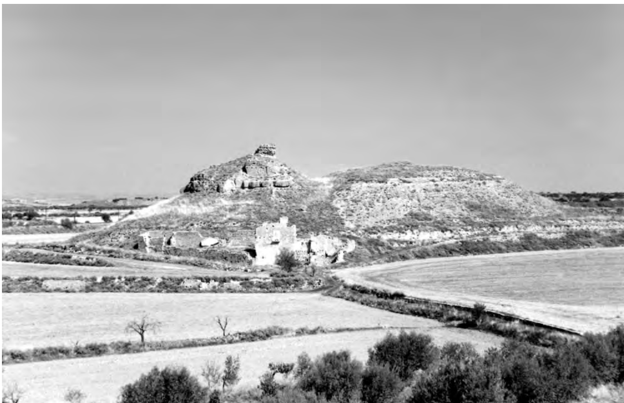
Restes arqueològiques del castell de l'Ofegat, (Tàrraga).

d'aquests castells desapareguts, observant la topografia característica de l'indret. És força corrent que aquestes construccions defensives s'alcessin en algun lloc elevat, tot dominant alguna via de comunicació important o algun pas fluvial, i que s'assentessin sobre grans roques. A més, moltes d'aquestes elevacions, com a la Figuerosa, Lluçà, l'Ofegat, Montalbà..., encara conserven els fossats artificials que aleshores es realitzaren per a fer més inaccessible aquestes forteses.