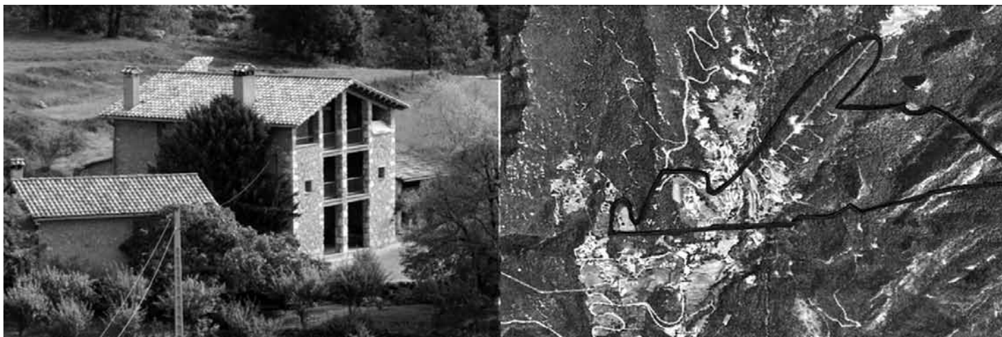
L'Ínsula. Límits marcats al google earth. POL PONS

Important també ja que tenen molts caps de