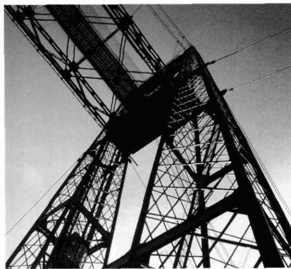
Detall del pont de ferro de Portugaleta, declarat Patrimoni de la Humanitat per la UNESCO i un dels elements més destacats de la Ruta del Ferro.

clou l'eminent valor social: fer reviure les vides d'uns homes i unes dones corrents conferint-los una identitat pròpia.