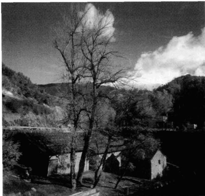
Vista exterior de la Farga Rossell d'Ordino (Andorra)