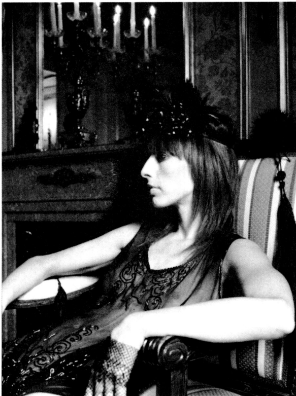
Imatge promocional de la vuitena edició de Circuit, en els actes de la Setmana de la Moda. (Gonzalo Gaioso)

Cada temporada Circuit combina el tema de la edición con un país invitado o un diseñador de renombre internacional, ofreciendo así la posibilidad de integrar nuevos talentos y diseñadores consolidados en el panorama nacional con diseñadores de renombre internacional como Vivienne Westwood.