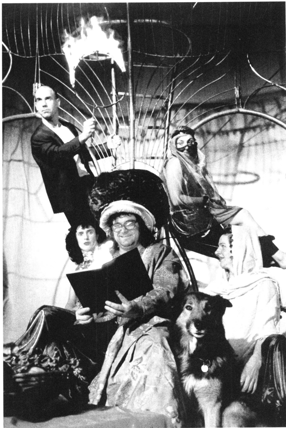
La nit de les mil llunes. Circ Crac. Mercat de les Flors. Barcelona, del 17 de desembre de 1998 al 3 de gener de 1999.