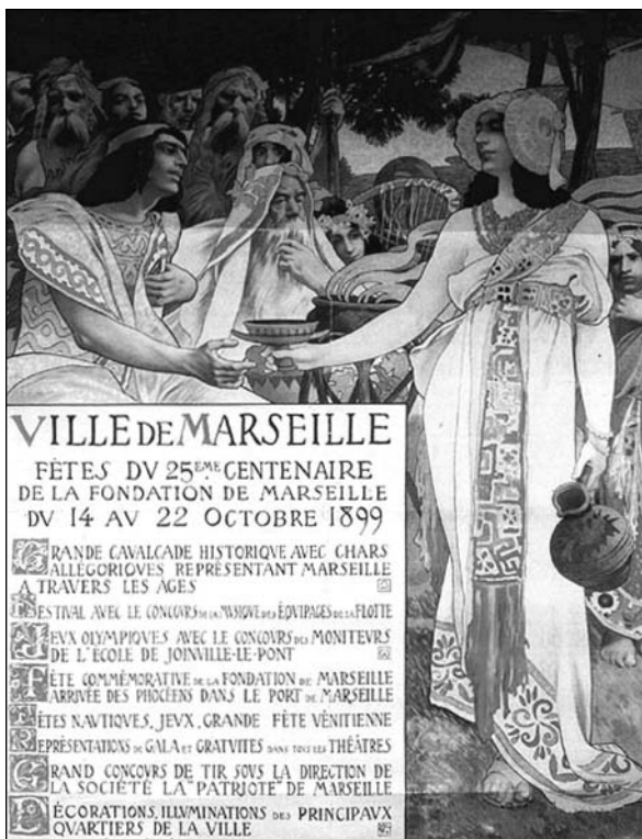
Fig. 2. Cartell commemoratiu del 25è centenari de la fundació de Marsella.

de la colònia al 15è any del regnat de Tarquini 29 . En referència a la fundació mítica de la ciutat serà especialment il·lustrativa la crítica a l'obra de Justí (Lib. 43), que es basa en l'obra de Trogu Pompeu i en la d'Ateneu (Lib. 13); en aquests es relata la relació entre el rei segoregi, Nannus , i els colonitzadors foceus, Simos i Protis . La llegenda presenta el matrimoni de la filla de Nannus , Gyptis , amb Protis com a filla/regal i com a beneplàcit per a l'establiment dels estrangers en territori indígena (fig. 2).