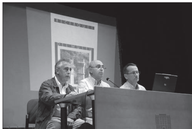
Acte de presentació de la revista del Museu.