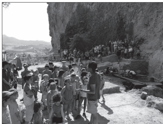
Jornada de Portes Obertes a les excavacions arqueològiques del Salt.

Entre els mesos de març i novembre es van realitzar les Jornades de Portes Obertes a les pintures rupestres de la Sarga, i es va poder visitar el jaciment un diumenge al mes. L'atenció als visitants va estat a càrrec d'un arqueòleg, en horari d'11 a 14 hores, i l'activitat va registrar una mitjana diària de 120 persones, amb un total de 1.092 visitants. A aquestes xifres de visitants cal afegir 674 usuaris més que