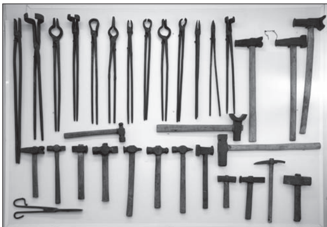
Ferramentes de manyà. Selecció del conjunt de les 224 peces donades.