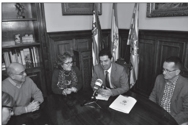
Signatura del conveni de col·laboració entre l'IVC+R i l'Ajuntament d'Alcoi.

El pressupost municipal de l'Ajuntament d'Alcoi de l'any 2011 ha atès les despeses ordinàries hagudes al Museu amb motiu de la realització de diferents activitats, per al manteniment de l'edifici i les instal·lacions, les quals han ascendit a un total de 36.190,65 euros.