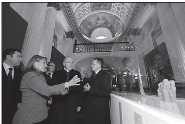
Acte inaugural de l'exposició Camins d'Art , a la capella de la Mare de Déu dels Desemparats, on s'hi van exposar les peces arqueològiques.