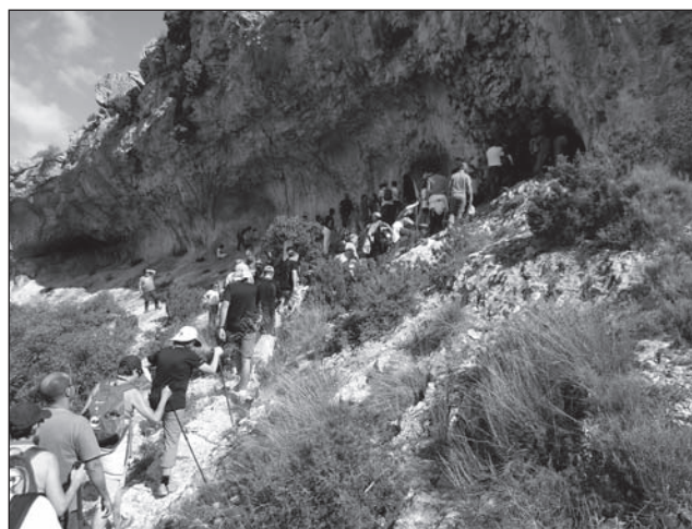
Participants a les Jornades de Portes Obertes a les pintures rupestres de la Sarga.