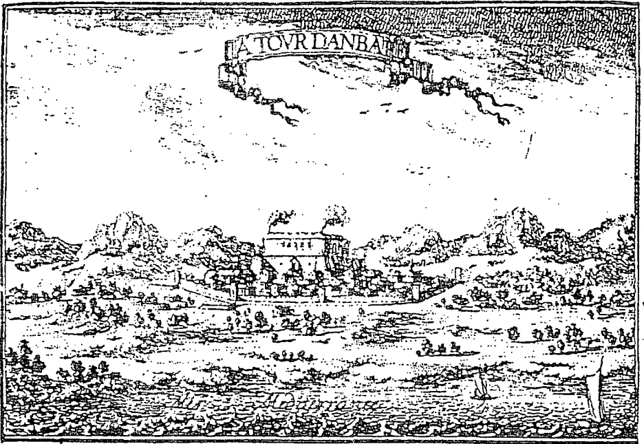
Torredembarra.— Antiga vista de la població, feta per Beaulieu en 1646 Fig. 1

L'any 1646, en Beaulieu (que en realitat es deia Sebastien de Pontault, enginyer, i no pintor) passà per Torredembarra, i dibuixà dos plànols, el primer (fig. 1), vindria a ser un alçat, on s'hi veu la Vila des del Surest i la seva projecció seria al Nordest; podem distingir-hi el cinturó emmurallat, amb cinc torres i el Castell nou a l'interior de la muralla. Resulta difícil distingir altres edificis a l'interior d'aquesta: Església, Castell vell, etc. En aquest plànol no hi ha cap llegenda o nota explicativa. A diferència de l'altre plànol, (fig. 2) que seria una planta on, a més del dibuix de la Vila, s'especificuen sota l'epígraf de «TABLE», els diferents elements que configuraven l'estructura urbanística essencial de Torredembarra. Fins i tot s'hi representa una escala en toeses (una toessa equival a uns dos metres), i, damunt de l'escala, la següent llegenda «PLAN DE LA TOUR D'ANBARE».