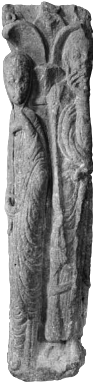
[fig. 7] Santa Maria de Solsona. Columna historiada amb personatges d'una Anunciació. MDCS 141

l'ha considerada com un element d'escultura arquitectònica, que la historiografia ha situat tant en una portalada[21] com en els accessos al claustre,[22] o, finalment, en la mateixa porxada del claustre,[23] hipòtesi aquesta darrera que hem seguit en diverses ocasions.[24] Però l'aspecte que més ens interessa ara és interpretar els seus vincles amb Gilabertus i la resta de conjunts tolosans. Així, els treballs de Moralejo sobre el conjunt van posar de manifest els successius estadis, en termes de cronologia relativa, reflectits en les escultures solsonines conservades, tot suggerint una estreta vinculació amb Gilabertus i la seva evolució a cavall de la seva experiència tolosana i de la seva possible aportació a Solsona. És així com podria entendre's la presència del fust de columna amb els dos personatges d'una Anunciació [fig. 7] i, també, el relleu a mena de fris amb una escena de discòrdia.[25] En aquest sentit, convé afegir que alguns dels motius presents en el claustre, com alguns tipus de temes vegetals, semblen respondre més al taller de la sala capitular de la Daurade, més avançat cronològicament.