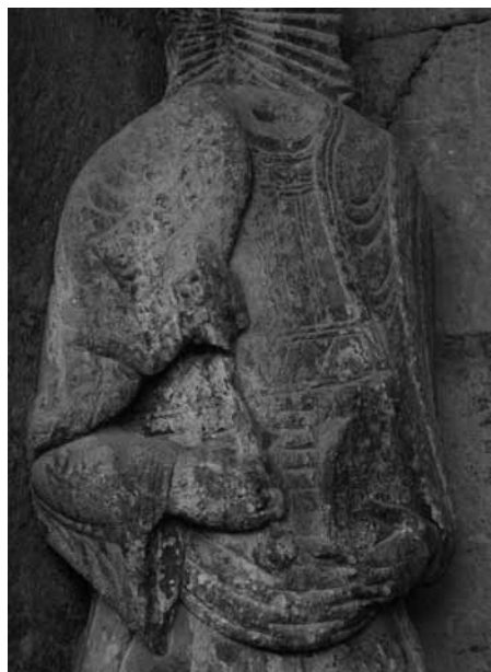
[fig. 4] Santa Maria de Ripoll. Muntant esquerre de la portada. Detall de la figura de sant Pere

pia cultura artística ripollesa i dels seus lligams amb el coneixement de l'Antiguitat.[15] Amb tot, no hi ha dubte que una sèrie de recursos estilístics presents a Ripoll tenen deutes amb obres tolosanes, tal com ha estat revisat recentment.[16] Més enllà d'aquestes coincidències que permeten apropar indiscutiblement aquests dos mons, una altra problemàtica és la generada per la presència de les dues figures dels muntants, sant Pere i sant Pau, adossades als fusts de les columnes [fig. 4-5], que han fet pensar en les figures dels apòstols de