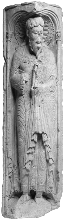
[fig. 1] Pilar amb l'apòstol Andreu, procedent de Saint-Étienne de Toulouse. Musée des Augustins, Inv. Me 22

seva trajectòria, marcades pels estímuls de l'escultura dels sarcòfags tardoantics i per una experiència a Toscana.[11]