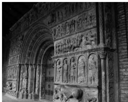
[fig. 3] Santa Maria de Ripoll. Portada. Visió general

pia cultura artística ripollesa i dels seus lligams amb el coneixement de l'Antiguitat.[15] Amb tot, no hi ha dubte que una sèrie de recursos estilístics presents a Ripoll tenen deutes amb obres tolosanes, tal com ha estat revisat recentment.[16] Més enllà d'aquestes coincidències que permeten apropar indiscutiblement aquests dos mons, una altra problemàtica és la generada per la presència de les dues figures dels muntants, sant Pere i sant Pau, adossades als fusts de les columnes [fig. 4-5], que han fet pensar en les figures dels apòstols de