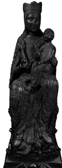
[fig. 6] Santa Maria de Solsona. Mare de Déu del Claustre