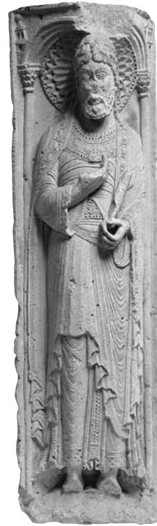
[fig. 2] Pilar amb l'apòstol Tomàs, procedent de Saint-Étienne de Toulouse. Musée des Augustins, Inv. Me 5

Des d'una perspectiva actual, un dels aspectes característics dels pilars dels apòstols de Saint-Étienne és el seu format, les seves dimensions monumentals, de manera que les figures destaquen del seu propi marc arquitectònic a través del rebaixat del bloc de pedra en biaix. Així, i mitjançant un treball preciosista, elegant i marcat per un clar interès pel detall, les figures adquireixen corporeïtat. Les relatives analogies amb les experiències de l'Île-de-France, en especial les de les portades de Saint-Denis i de la catedral de Chartres en la presentació de les columnes figurades (anomenades estàtues-columna), han estat per alguns autors element de comparació obligada i referent per situar cronològicament les experiències de Saint-Étienne, fins al punt que de vegades s'han datat amb posterioritat a les septentrionals.[12] Amb tot, recentment les obres de la sala capitular de la catedral tolosana s'han datat en moments anteriors, i concretament cap a l'any 1120, datació que transcendeix de cara a la consideració i contextualització d'alguns conjunts catalans vinculats amb l'escultura tolosana.[13]