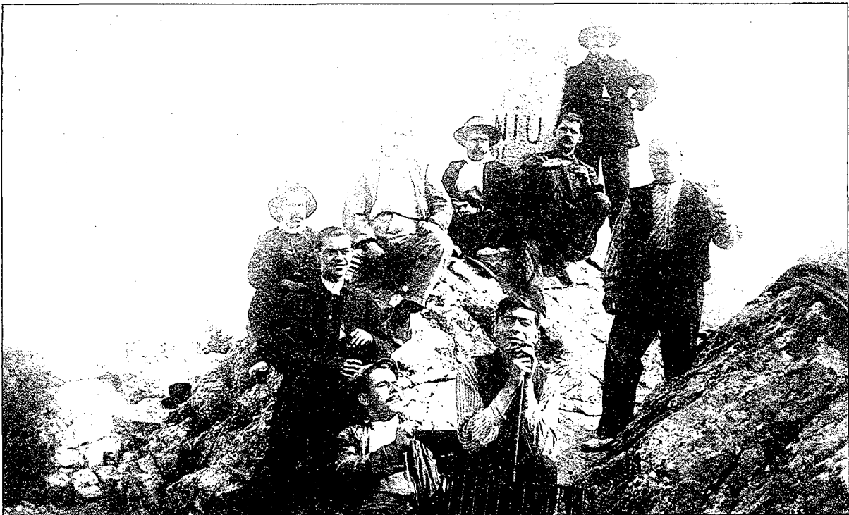
Socis de l'Ateneu al cim del Puig d'Olorda a Santa Creu. Entorn 1920.

El transport des de Barcelona es va efectuar el dia 24 d'octubre de 1885, per la carretera Reial, amb quatre carros fins al peu de la muntanya d'Olorda, on