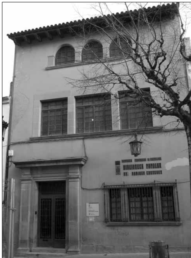
Façana de la biblioteca d'Esparreguera que porta el nom del beat