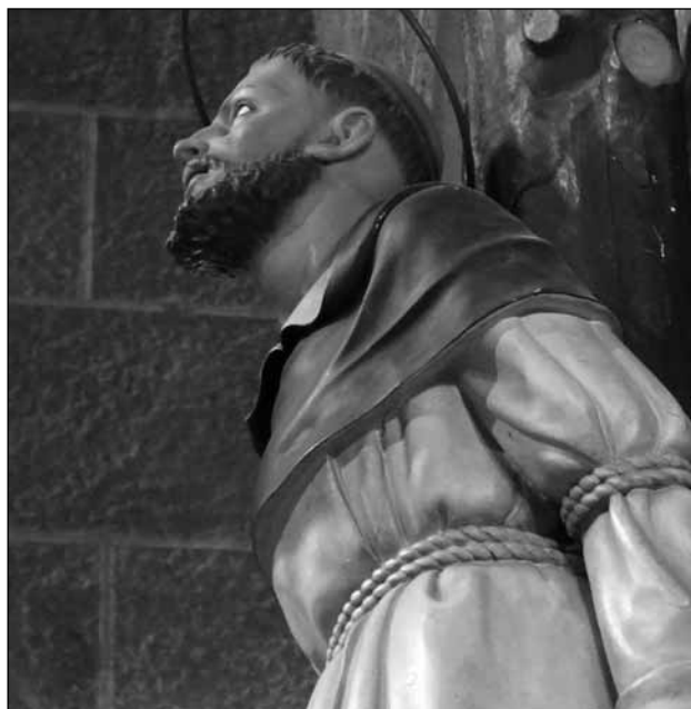
Imatge del beat Domènec Castellet que es pot contemplar a l'església parroquial d'Esparreguera