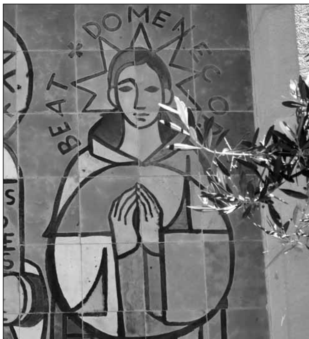
Mosaic del beat a la façana de l'església

al llunyà Orient. El pare Diego Aduarte, comissionat pel reclutament de missioners, abans de conformar l'equip, els va explicar les condicions i dificultats que es trobarien en aquelles terres llunyanes, el compromís que se'ls demanava de l'estricta observança de les Constitucions i regla de l'Orde dominicà i les incomoditats, perills i sacrificis que representava la perllongada navegació atlàntica cap a l'Orient. Tot estava contingut en un document que, després de ser llegit i estudiat, havien de signar. Al document hi havia un apartat amb el compromís d'aprendre la llengua dels nadius del punt de destí que els assignessin el superior per tal de predicar la doctrina cristiana. Un cop signat el document, el pare Aduarte es va constituir com a superior de l'equip de missioners i va començar els tràmits als departaments oficials per tal d'aconseguir els permisos, els diners i tot el que fos necessari, perquè totes les despeses del viatge anaven a càrrec de la Corona espanyola. 9 Mentre es gestionaven els tràmits, els religiosos tenien permís del superior per anar a acomiadar-se de les seves famílies i dels convents de procedència, ja que embarcar cap a les Filipines, el Japó o la Xina volia dir, de vegades, no tornar mai més. Domènec Castellet va signar el document, però no sabem si va tornar a Esparraguera per acomiadar-se dels seus.