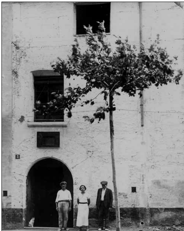
Casa anterior a la biblioteca que porta el nom del beat Castellet

Aquests precedents significaven tot un repte per a l'esperreguerí. De moment, Domènec era conscient que la seva tasca, un cop compromès pels seus vots religiosos, era la seva formació intel·lectual. Feia un any que, abans de vestir l'hàbit religiós, s'havia sotmès a la prova del suficient coneixement de la llengua llatina per tal d'enfrontar-se al ratio studiorum de l'època, en què tot l'ensenyament de la filosofia i la teologia es feia en llatí. El currículum d'estudis de tot frare dominic constava d'un primer cicle de formació filosòfica, començant per l'aprenentatge de les regles lògiques del raonament i endinsant-se a continuació en la visió aristotèlica dels éssers i del món. Després vindrien els llargs estudis de teologia, aprofundint en l'exposició metòdica de la veritat revelada en la Sagrada Escripura i en la tradició de l'Església, seguint sempre la doctrina del Doctor Angelicus, Sant Tomàs d'Aquino. La formació intel·lectual no era, però, la meta final, sinó que la culminació era l'ordenació sacerdotal que li permetria el contacte ministerial amb el poble cristià durant la celebració de l'eucaristia, l'administració dels sacraments i la predicació de la paraula sagrada.