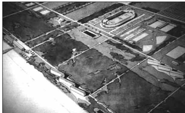
Plànol d'equipaments i lleure projectats per a la "Ciutat del Repòs"; perspectiva aèria que mostra la realitat virtual de l'estadi.

complex projecte 11 mai no podran ser avaluades en l'àmbit del Baix Llobregat. Creiem que es pot parlar de desgràcia tant pel motiu que paralitzà la iniciativa, com per la pèrdua d'una oportunitat d'aquelles que qualifiquem d'"històriques". De fet, el que s'havia gestat a les taules de dibuix dels arquitectes tot pensant en la rodalia de Barcelona que ens ateny, va esdevenir un model, tant pel que fa al plantejament conceptual com per les solucions ideades per a d'altres projectes.