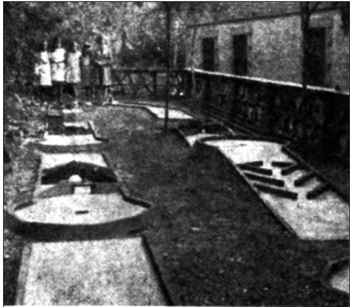
Minigolf de la Colònia Amat (Gavà), el 1912. Font: Revista La Família . Il·lustració reproduïda també al quadern de divulgació La Sentiu , núm. 27, any 2003, p. 19.

gavanenca: el propietari tenia el projecte de fer arribar un tramvia fins a la platja –en concret, a la zona coneguda com la dels Nou Rals-, on hi hauria construït un establiment de banys 5 . Però per veure una realitat tangible de banys a l'estil dels primers que citàvem en l'article ens haurem de desplaçar a Castelldefels.