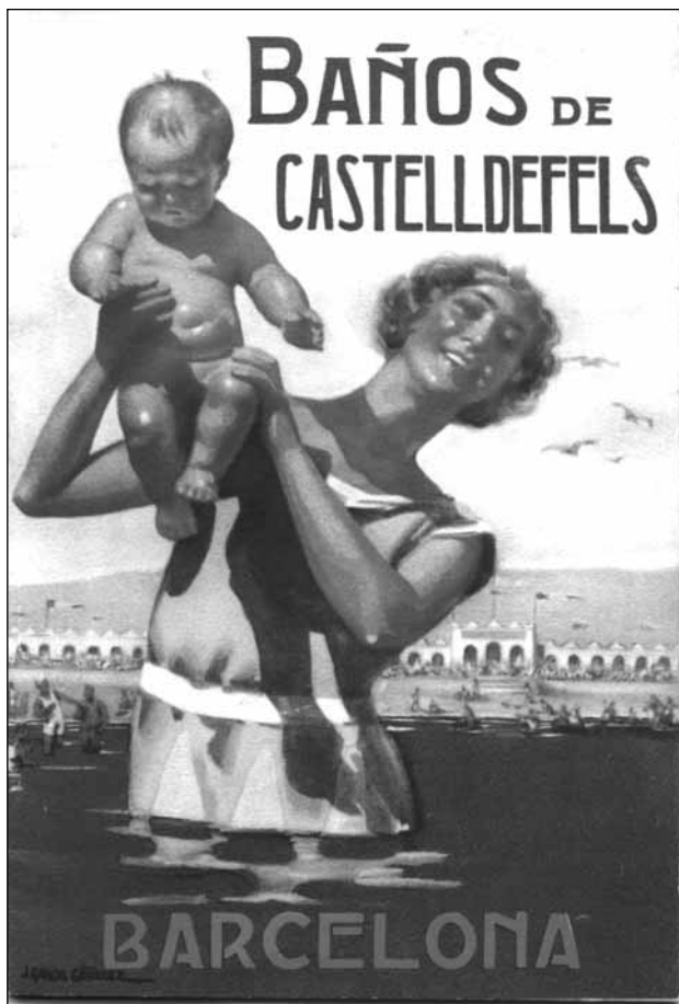
Portada del prospecte de Baños Castelldefels editat el 1930.

projecte urbanístic que preveia la necessitat d'oci i espais adients per gaudir-ne. Per al nostre interès sobre el foment de l'esport, aquí és on apareix algun dels aspectes previstos pel GATCPAC per a una superfície d'actuació de 12.000 hectàrees.