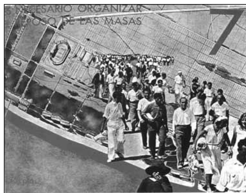
Portada del número 7 de la publicació del Grup d'Arquitectes i tècnics Catalans pel Progrés de l'Arquitectura Contemporània . Presenta la visió ideal de "La ciutat de Repòs i de Vacances" amb les pertinents instal·lacions esportives.