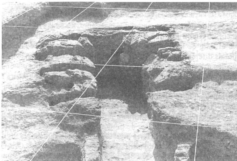
Vista de la cambra de cocció i pilars del forn núm. 1.

d'amplada, per dos metres, de llargada. Aquesta cambra tenia adossats a cada una de les parets que delimitaven la seva amplària tres conjunts de dos pilars que, originàriament, havien d'estar units mitjançant una volta, de la qual només roman l'arranjament en quatre d'aquests sis pilars. Aquesta volta devia sostenir la cambra de cocció, la qual ha desaparegut. Només s'ha conservat algun fragment de la graella per on es devia comunicar el foc entre les dues cambres. La profunditat de l'excavació en aquest forn arribà fins els 80 cm.