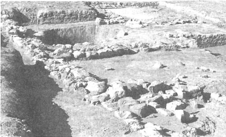
Vista general dels àmbits 1, 2, 3 i 5.

L'àmbit 3 es troba a continuació de l'habitació anterior, al nord. És de planta quadrada, de 4 m de llarg i d'ample. És una dependència oberta a l'est i al nord. A l'est comunica amb l'exterior, del qual només la separa un mur d'1,5 m de llarg, al qual s'uneix el mur que fa de separació amb l'àmbit 4, situat al nord d'aquesta habitació. Aquest mur és, només, d'1 m de llarg, la qual cosa fa que l'àmbit 3 estigui també obert cap a aquesta àrea, és a dir, cap a l'interior del conjunt arquitectònic en aquest cas. Això no obstant, com a element definidor, assenyalem la presència en el seu interior d'una gran cavitat al terra. Una vegada excavat el nivell superficial, es va posar al descobert un nivell amb molta concentració d'argiles i restes de carbó, on es retallava una estructura circular, la boca de la qual tenia un diàmetre irregular de 2,5 m. La seva fondària és d'1,80 m. Creiem que es tracta d'una pastera on es realitzava la barreja de l'argila, l'aigua i el sauló per obtenir la matèria necessària per iniciar el procés d'elaboració. Aquesta hipòtesi queda consolidada en haver documentat l'estrat 0020, que correspondria a les restes de l'última barreja efectuada al seu interior.