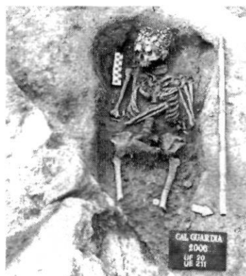
Inhumació en fossa rectangular afectada per fonamentacions posteriors

Tot fa pensar que la necròpolis havia de tenir unes dimensions superiors que no s'han conservat. El terreny ha sofert rebaixos, ja fossin quan eren zones de cultius o a l'hora de construir les cases. El cementiri segurament s'estenia en totes direccions, però per la única part on encara es podria conservar alguna sepultura és per la zona est, on el mur exterior del mas, que separa la plataforma mitja de la superior, pot amagar un pendent suau i la possibilitat que existeixin més inhumacions, tot i que en la rasa i el sondeig realitzats a la plataforma superior els resultats han