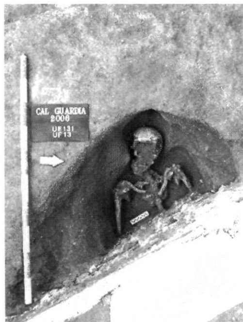
Inhumació en fossa antropomorfa afectada pels murs de la placeta de la font de Sant Domingo