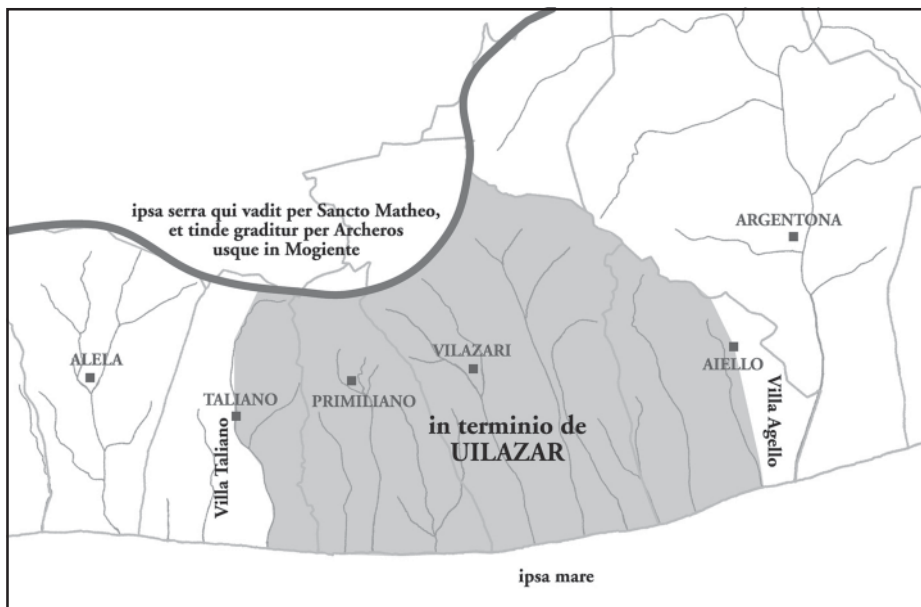
Representació gràfica dels límits descrits en l'empenyorament de l'any 992. Vilassar arriba de Teià a Agell.