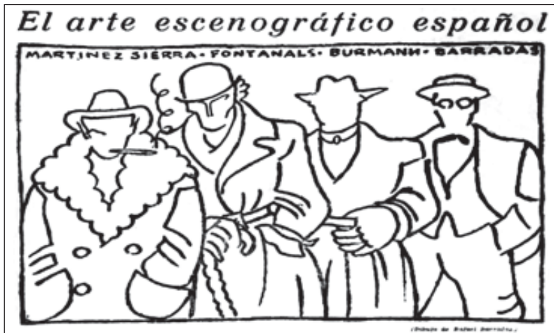
«El equipo que mató los viejos decorados», segons R. Barradas.