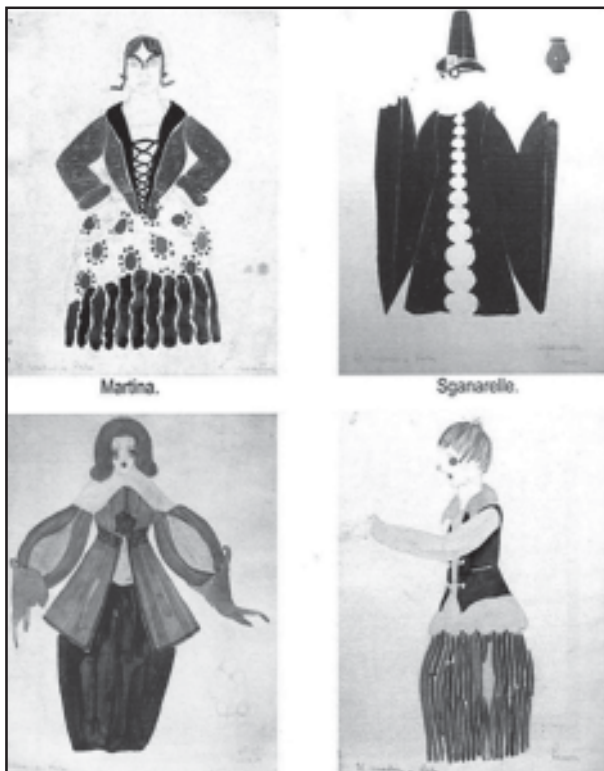
El médico a Palos de Molière. Figurins dissenyats per M. Fontanals (Museo Nacional de Teatro de Almagro. Donación Enrique Fuster).

(Aquestes imatges i les següents de Manuel, reproduïdes del llibre de Rosa Peralta).