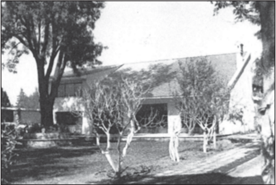
Casa de Gabriel Figueroa, a Mèxic, dissenyada per M. Fontanals.