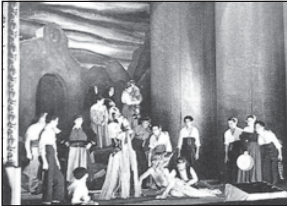
Escenografies de M. Fontanals per a Yerma i Mariana Pineda de García Lorca.