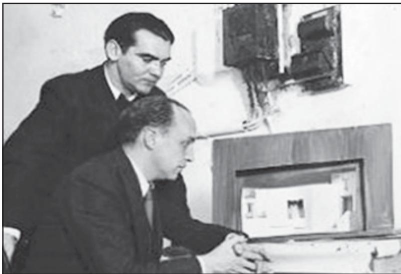
Amb García Lorca observant la maqueta d'una escena de La zapatera prodigiosa (1933).

(Aquestes imatges i les següents de Manuel, reproduïdes del llibre de Rosa Peralta).