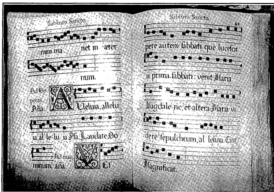
Llibre de Cor de Santa Maria. Segle XVII. MASMM.