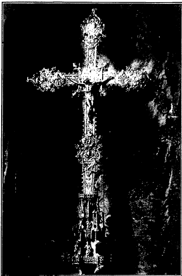
Creu parroquial de Santa Maria. Obrada per Gabriel Ramon (1611).

L'intervencionisme de les autoritats comunals en els afers parroquials no es deturava sols en els aspectes infraestructurals. En el tombant del segle XVI al XVII la Universitat de la vila intentà dur a terme una important reestructuració dels mecanismes econòmics que regien la parròquia, per tal de facilitar l'accés d'un major nombre de preveres, fills de la vila, a les importants rendes que confluïen en la institució parroquial. Aquestes gestions, mantingudes per la vila directament amb les autoritats romanes, no assoliren el bon succés que hom n'esperava. Aquest element, entre d'altres, féu que les relacions entre la Universitat i els rectors, i entre aquests i els seus preveres, fossin sovint marcades per la conflictivitat. Aspecte que ha estat objecte d'un estudi específic en curs d'elaboració.