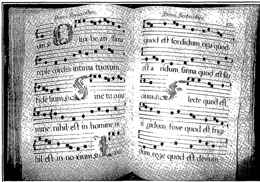
Llibre de Cor de Santa Maria. Segle XVII. MASMM.

Com explicar aquest singular moviment estratègic? Probablement, tot i que la major part de les reivindicacions del col·lectiu de preveres eren vistes amb bons ulls pels membres de la Universitat —principalment aquelles que tendien a debilitar el poder omnímode de què gaudia el rector—, altres de les reivindicacions clericals eren difícilment assumibles pel govern de la vila. En aquest sentit, la petició dels preveres de limitar el nombre de les admissions a la xifra de 22, contrariava obertament les aspiracions de l'oligarquia que controlava el consell, molt gelosa de preservar per als seus fills segons l'accés al temple parroquial. Una altra pretensió dels clergues era la d'obligar els feligresos a haver de convocar-los tots en celebrar-se les cerimònies fúnebres. Aquesta pretensió significava una despesa molt important, que una bona part de la població no podia satisfer sense dificultats, la qual cosa degué incidir en què probablement aquesta reivindicació fos la que decantés el govern municipal a arreglerar-se en la posició defensada pel rector. La destitució del mestre de capella i de l'organista foren probablement una forma d'exemplaritzar l'actitud de les autoritats municipals en contra de les agosarades pretensions dels díscols preveres. Així a Mataró hom inicià la divuitena centúria amb un sorollós