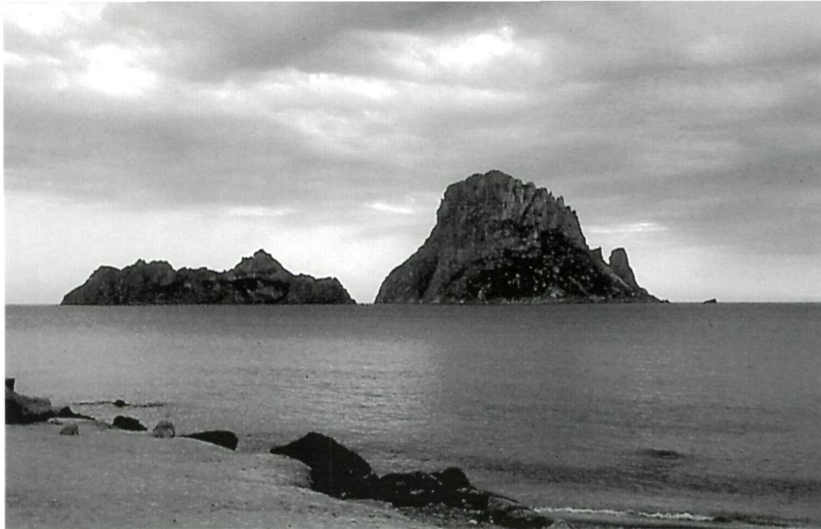
El Vedrà i el Vedranell vistos des de cala d'Hort.