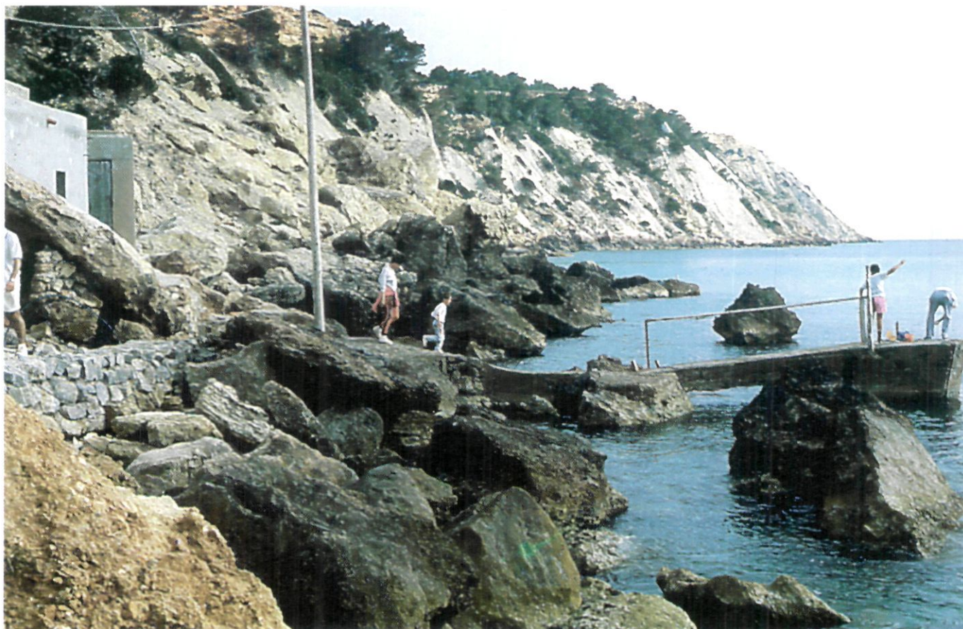
Vista de cala d'Hort.