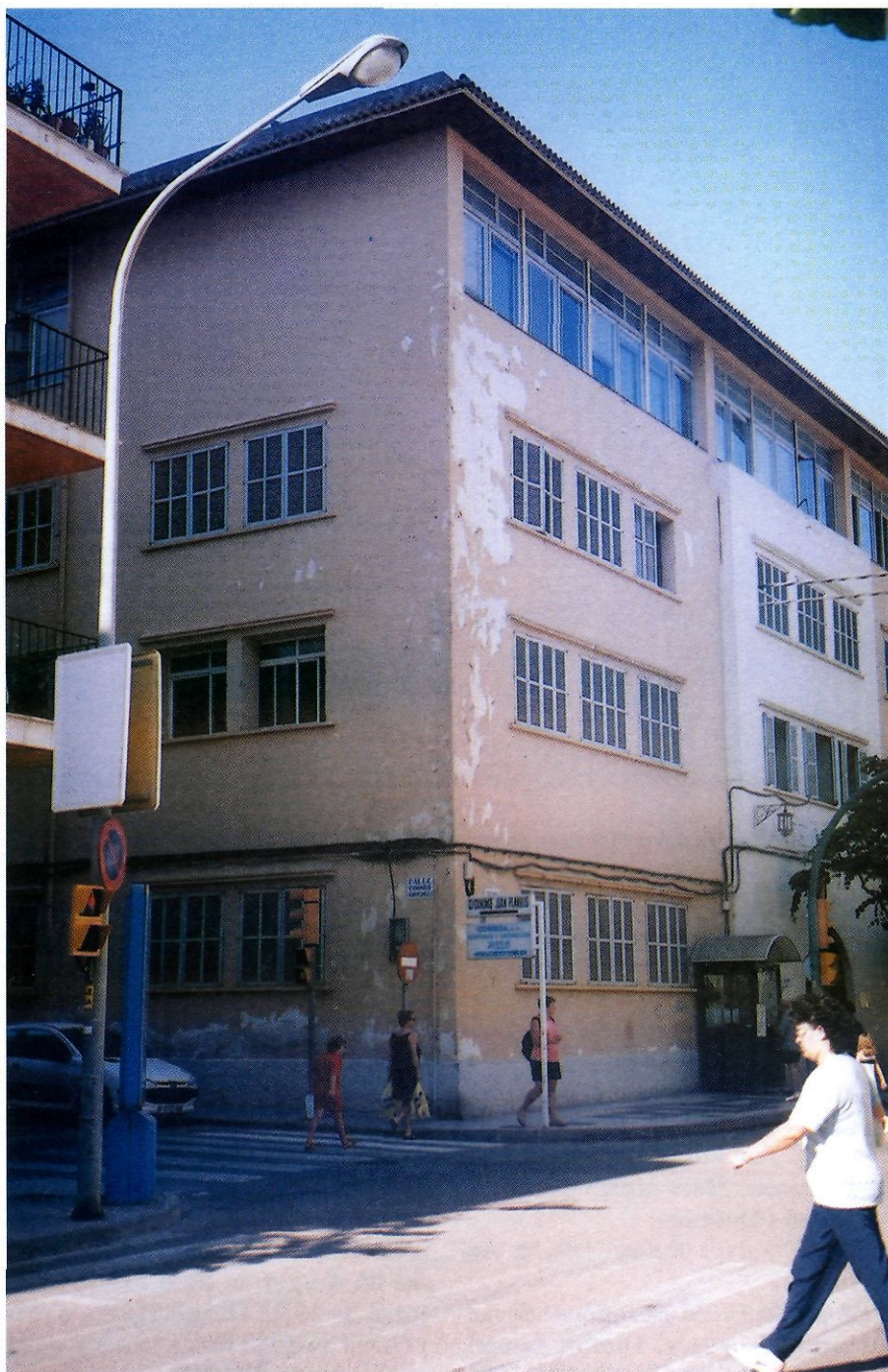
L'edifici de l'Escola a l'actualitat.

seua jubilació, l'any 1981. La seua feina fou premiada amb la Creu de l'Orde d'Alfons X el Savi. Tots els eivissencs ens adherirem a la distinció. I és que, com deia ell, tres mil alumnes havien passat per les aules de l'Escola.