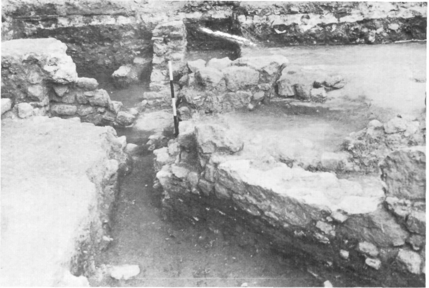
Vista parcial de l'habitació de la cala III. Al fons a l'esquerra el pou àrab.

fixats als buits corresponents amb argila.