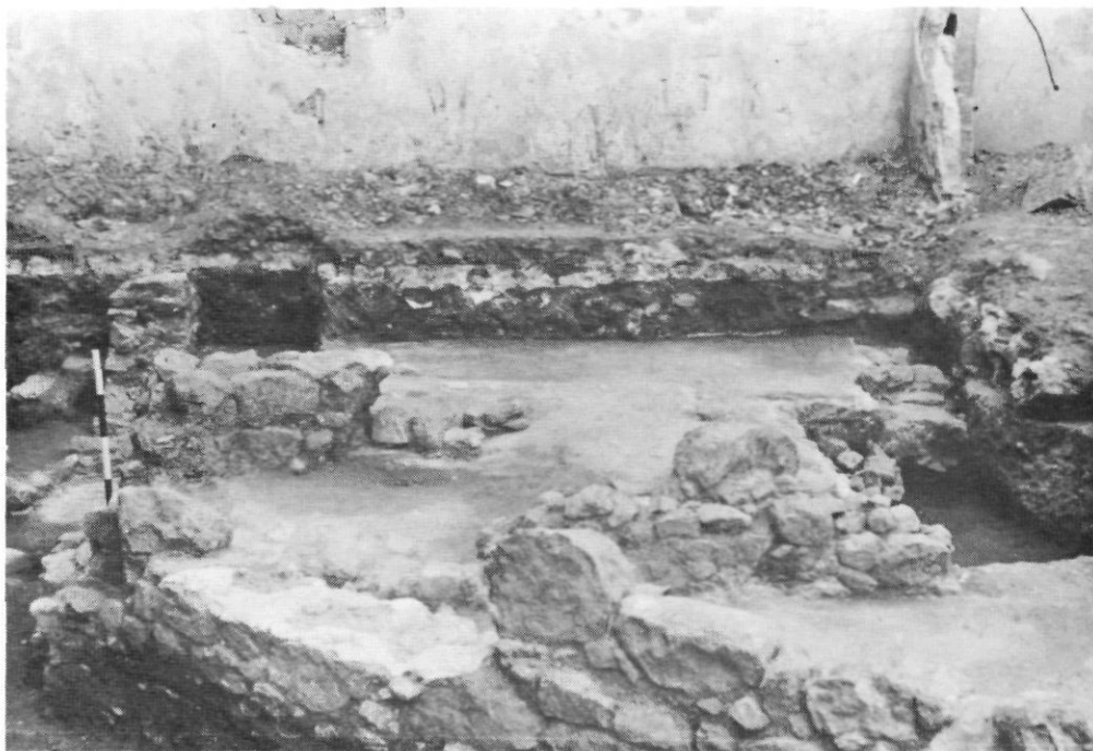
Vista parcial de l'excavació, amb l'habitació de la cala III en primer pla a la dreta.

Les quatre cales proporcionaren una estratigrafia semblant, que quedarà reflectida al final d'aquesta memòria.