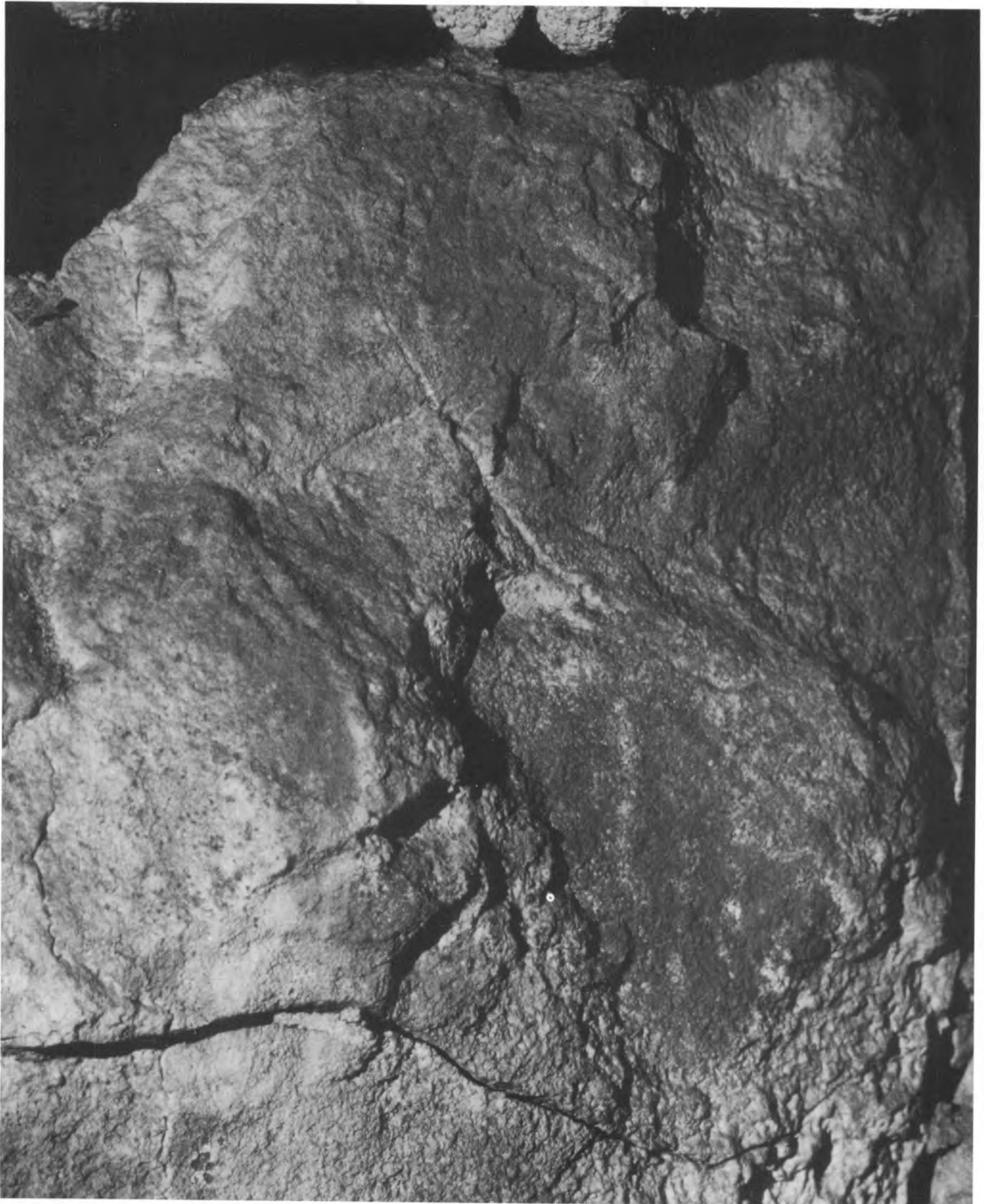
Fig. 2. - Cérvol gravat de la cova de la Tarverna.

als i retoc de la pedra per escultura) i el lloc de troballa, amb llum exterior, pràcticament a l'entrada de la cavitat, la cova dels Rogerals. Qualsevol altre indret de paral·lelisme no ha arribat, de moment, a bon port, encara que ens proposem d'extendre la recerca el màxim possible en vistes a la publicació definitiva.