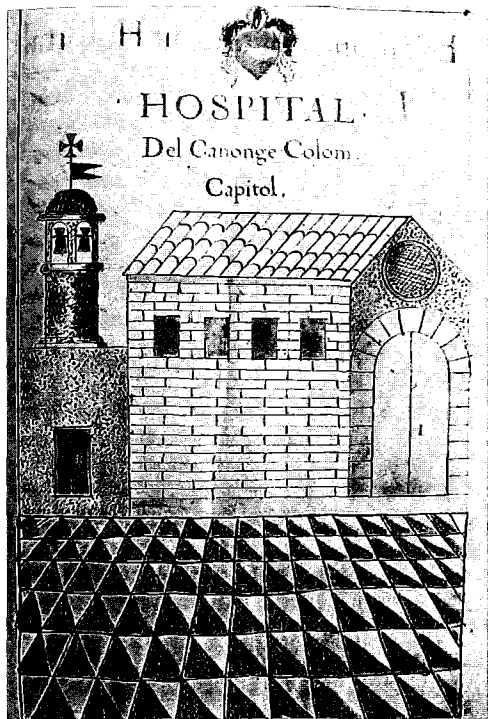
Hospital del canonge Colom al carrer de l'Hospital

después a la extinció del Colegio y consiguiendo abandono del edificio, que por no ser, sin duda, obra arquitectónica de excelencia, caminó rápidamente hacia la ruina". (23) A partir de la documentació de primera mà, continguda als Registres de Deliberacions i als Manuals del Consell, ara estem en disposició d'ampliar aquestes informacions.