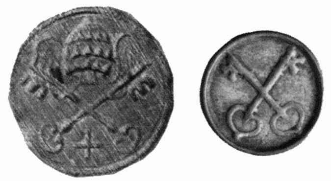
Figura 5. Pellofes conegudes procedents de l'església de Sant Pere de Figueres (foto extreta del catàleg de subhastes numismàtiques Aureo & Calicó, Subhasta numismàtica, col·lecció Llorenç Balsach 2008, núm. 5467 i 5474).

Un altre element comú als tipus A i B és la tiara o la mitra. En el cas de la única pellofa del tipus A, l'estat de conservació no permet una lectura molt acurada de la imatge; les pellofes del tipus B, en canvi, amb un total de 12 exemplars, sí que proporcionen una figura molt més detallada. L'ús de l'emblema de la tiara o la mitra, així com de les claus, per part del monestir de Sant Pere de Rodes, que de fet és un símbol papal, és una de les prerrogatives de què disposaven els abats del monestir des del segle XIII (Clavaguera, 1986: 50).