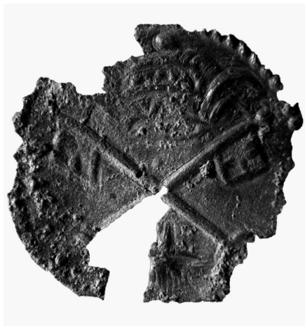
Figura 2. Exemplar de pellofa del tipus A (número d'inv. 26).

La semblança entre les pellofes del tipus B i C és tan remarcable que, fins i tot, es pot suposar que serien molt properes en el temps i que podrien