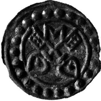
Figura 4. Exemplar de pellofa del tipus C (núm. d'inv. 24).

tenir un origen comú, ja que només varia l'element central, la tiara o la M. La pellofa del tipus A, en canvi, és de major diàmetre, i tot i tenir una iconografia similar, podria ser d'un altre moment, potser posterior a les del tipus B i C, com defensarem més endavant.