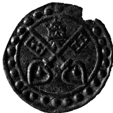
Figura 3. Exemplar de pellofa del tipus B (número d'inv. 8).