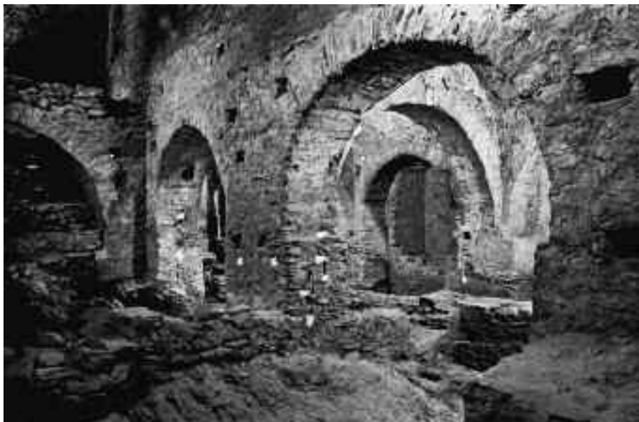
Figura 3. Vista general de les construccions descobertes en el subsòl del pati i la galeria est del claustre del segle x. (Foto: J.S. Carrera).

Les restes de l'església que hauríem d'associar a aquestes construccions primitives no es varen descobrir fins a les campanyes dels anys 1994 i 1995 (Llinàs et alii , 1996: 266-267), durant l'excavació del temple que avui coneixem. D'aquest primer edifici només se'n van intuir les dimensions de la planta i part de l'absis semicircular, el qual és visible des de la cripta (Fig. 1.3). Se li va suposar una planta d'una sola nau, sòbria i modesta, d'una amplada màxima de 3 m, emplaçada damunt una plataforma natural del terreny. La construcció de l'església posterior, iniciada a partir de mitjan segle x gràcies a la iniciativa de Tassi, l'hauria pràcticament arrasat. Al voltant d'aquesta església, no al seu interior, es recuperaren altres 15 enterraments de la necròpolis de tombes antropomorfes a la qual ens hem referit, que correspondrien a la sagrera d'aquesta església pel costat de ponent i migdia, a les quals hauríem de sumar les trobades en campanyes antigues a l'espai de la galilea, i dos més en el sòl de la cripta.