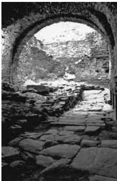
Figura 2. Vista general de les estructures localitzades en el subsòl de l'ala nord del palau de l'abat.

subsòl natural. Al marge de la presència de ceràmiques africanes tardoromanes, tant d'àmfora com de cuina, i de tegulae , presents també en altres punts del monestir, sobre les quals insistirem més endavant, el material determinant, pel que fa a la cronologia, tot i ser molt escàs, fou la ceràmica espatulada i les olles de cuita reductora. Aquests materials serien els que permetrien situar-nos en un context, com a molt antic, a partir del segle IX.