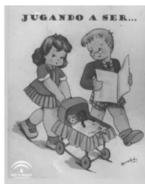
Junta de Andalucía, 2006

En esta apuesta por la educación en valores, nos gustaría terminar nuestra reflexión con una iniciativa procedente del Ayuntamiento de Alaquás (Valencia) consistente en aunar los lenguajes de la publicidad con la educación en valores de corresponsabilidad. Se trata de una actividad llevada a cabo en 2007 a través de colegios en la que se les pedían a niños y niñas que realizaran dibujos que luego ilustrarían un calendario. En el producto final vemos como los dibujos de niños y niñas plasman la corresponsabilidad que tan escasamente encontramos en los medios. Los tres dibujos que reproducimos a continuación constituyen las tres partes de la imagen superior de la página del mes de junio. En cada mes las tareas a realizar en cada día se estructuran tal y como aparece en el cuadro final para que cada uno/a de los/as miembros/as de la familia introduzca su nombre.