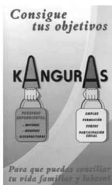
Junta de Castilla-La Mancha, 2006