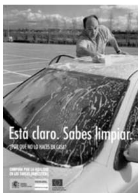
Instituto de la Mujer, 2003

A pesar de lo expuesto hasta ahora, los recientes cambios legislativos nos ofrecen un marco en el que explorar, buscar y desarrollar nuevas iniciativas publicitarias que legitimen pautas alternativas de configuración de imaginarios identitarios. Nos referimos no sólo a las iniciativas de concienciación procedentes de instancias nacionales, como el Instituto de la Mujer, o autonómicas, como la Junta de Castilla-La Mancha o la de Andalucía, que vemos abajo, sino a aquéllas consistentes en el diseño y desarrollo de una estrategia integral que contemple la educación en valores de igualdad, conciliación y corresponsabilidad.