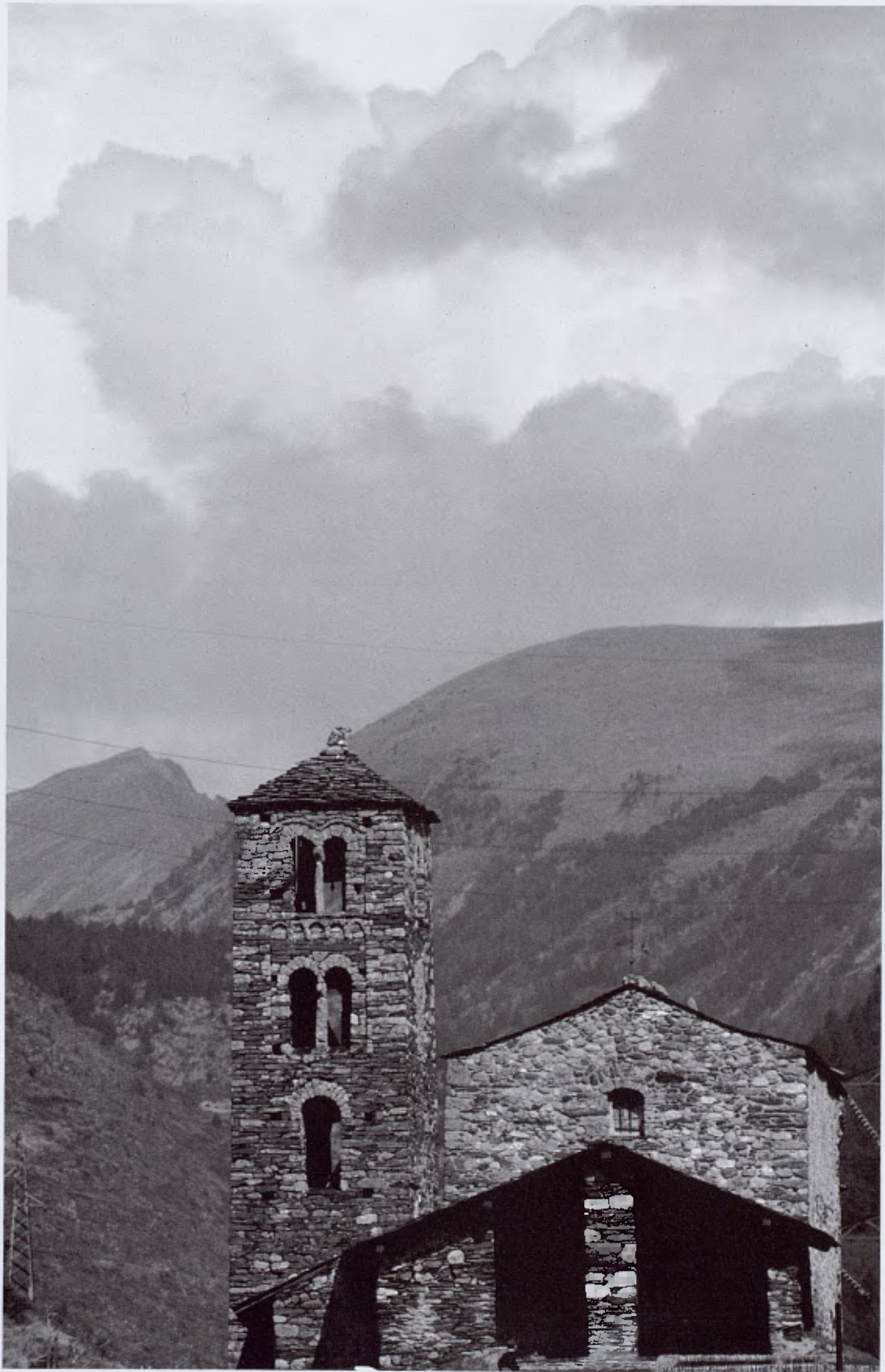
SANT JOAN DE CASELLES