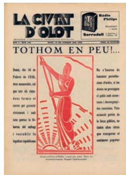
<< Una portada de la revista Ciutat d'Olot, òrgan d'Acció Catalana Republicana.

El republicanisme contemplava l'art des d'una òptica idealitzant, com un objecte de gaudi estètic i un mitjà d'emancipació