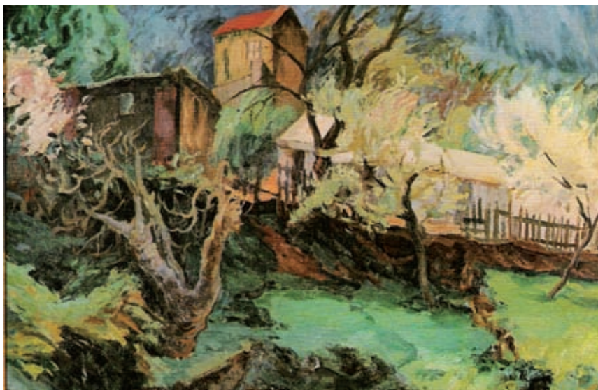
MUSEU MUNICIPAL DE TOSSA