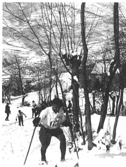
Proves d'esquí a fons a Ribes de Freser, l'any 1917.

Les excel·lents condicions geogràfiques i climatològiques de la badia de Palamós, així com la tradició en aquest esport, varen fer pensar els organitzadors dels Jocs Olímpics de Barcelona 92 a portar-hi les competicions de vela. Finalment, però, es varen disputar a Barcelona, el que va provocar clar desencís entre tots aquells que volien que les competicions de vela vinguessin a les comarques de Girona. Ara, quasi una dècada després, aquest greuge sembla que es comença a saldar. L'any passat, la Generalitat, l'Ajuntament, la Diputació de Girona i la Federació Catalana de Vela varen signar un protocol per crear a Palamós un centre d'alt rendiment de vela. Si s'acompleixen els terminis, la nova infraestructura la podrien començar a utilitzar els esportistes que es preparen per als Jocs Olímpics d'Atenes de l'any 2004.