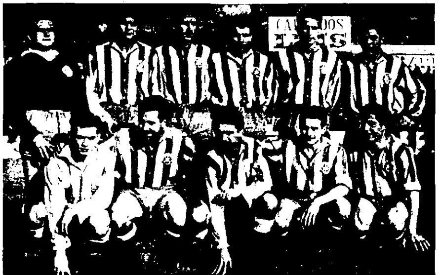
Primer partit a casa de la lliga d'ascens a segona divisió del Girona FC, l'any 1956: Girona 5 - Vilafranca d'Orla 0.

La primera meitat dels anys seixanta no varen ser bons per al Figueres, i tot i que al 1965 l'equip tornava a pujar, l'any següent feia una altra passa enrera. El club va viure entre penes i glòries fins arribar als anys 80, dècada que ha estat qualificada com la de la il·lusió. Les grans campanyes a la Copa del Rei i els ascensos de tercera a segona B i d'aquesta categoria a la segona A —l'any 1986, i de la mà de José Manuel Esnal «Mané»— van conformar