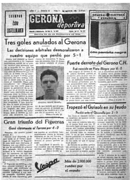
Portada del setmanari "Gerona Deportiva", de 1962.

Des del 1946 va jugar a la categoria regional, fins que al 1968 va aconseguir pujar a regional preferent. El següent pas endavant del Palamós va ser al 1987 quan, després de quedar sotscampió, va passar a militar a la tercera divisió. El trienni 1987-1989 es pot considerar com l'època daurada del club, ja que va anar pujant, any rere any, fins arribar a jugar a la segona divisió A del futbol estatal. Actualment el Palamós ha tornat a la tercera divisió.