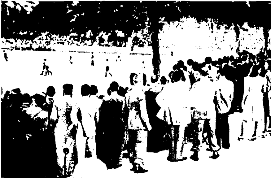
Partit de futbol al camp de Vista Alegre de Girona, els anys 40.

Un altre dels clubs de futbol destacats d'aquestes comarques és el Figueres. La Unió Esportiva Figueres es va crear el 13 d'abril de 1919 i la premsa de l'època ho va explicar dient que s'havia produït la unió de les societats esportives Sport Club Català, del Casino Menestral, i la Joventut Esportiva i Artística, del Casino Sport Figuerenc. Com que uns jugaven amb la camiseta blanca i els altres amb una de blava, la fusió dels dos colors va simplificar la feina de dissenyar un nou mallot, que va ser el tradicional de ratlles blanc i blau. Fins a jugar a l'horta de l'Institut —el primer camp—, l'equip buscava qualsevol espai per poder practicar aquest esport i fins i tot ho va fer a la plaça d'armes del castell de Sant Ferran. Uns anys després de la seva creació, la Unió ja jugava el campionat provincial, i al 1922 l'equip assolí el primer títol de campió provincial.