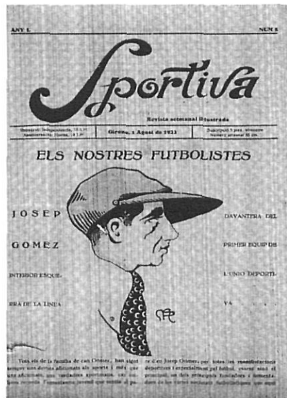
Portada de la revista "Sportiva", de 1922.