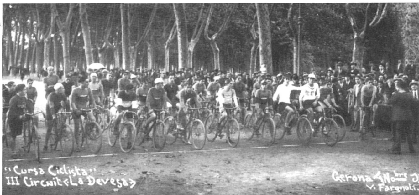
Cursa ciclista a la Devesa de Girona, l'any 1931.

recuperar el dia 1 d'abril de 1941. Tres anys després, el dia de Tot Sants, s'inaugurà l'estadi de la Devesa, de manera que abans d'arribar a la meitat del segle, ja s'havien creat noves seccions, com la d'handbol, una de les que més ha destacat a la segona part del segle juntament amb