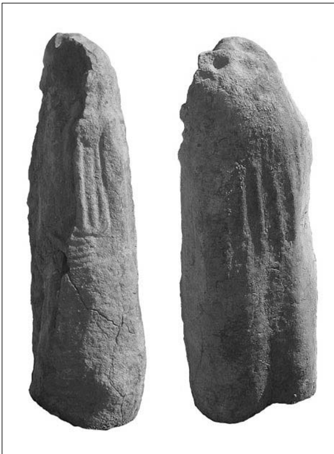
Figura 1. Vista frontal i lateral de l'estàtua menhir antropomorfa.

en determinades zones geogràfiques hi ha algunes coincidències per la tria dels trets que es representen i la manera de representar-los. Així nosaltres podem fer una descripció de les parts conservades en relació amb els paral·lels de les estàtues menhirs del grup de la Rouergue a l'Aveyron (França) i, de la mateixa manera, podem proposar algunes hipòtesis sobre la reconstrucció de la figura original.