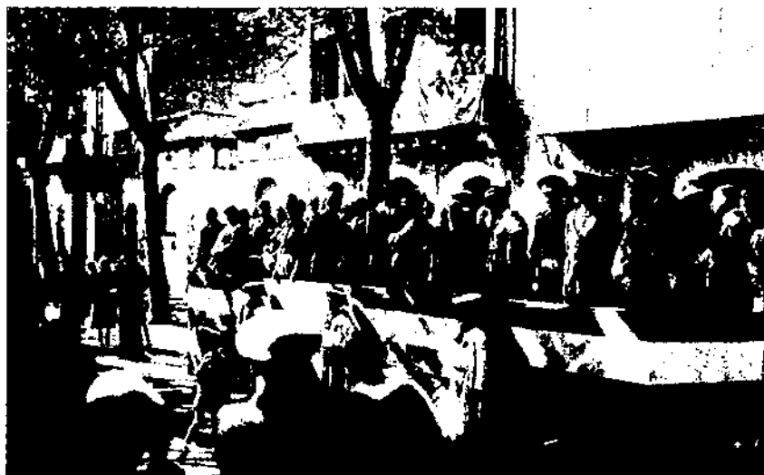
Presidència d'un «desfile» a la Rambla de Vilanova.