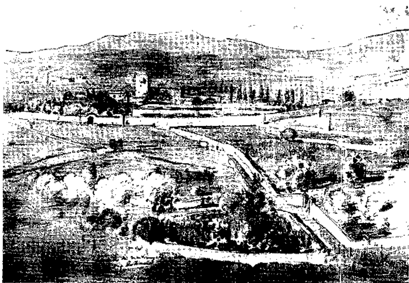
Les masies Xicarró i Solicrup, que foren destinades a les colònies infantils de refugiats «Francisco Giner de los Ríos» i «Joaquín Costa», segons dibuixos de Pau Roig Estradé.