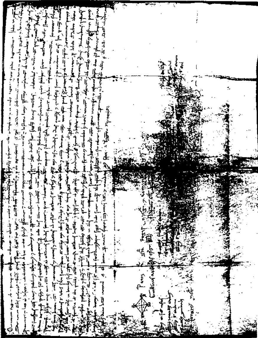
Concessió de Pere I de vuit dies de fires anuals, a comptar vuit dies després de Pasqua de Resurrecció. (A.C.A. Diversos. Locales. L'Arboç, pergami 2).