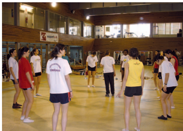
Posició bipodal bàsica.