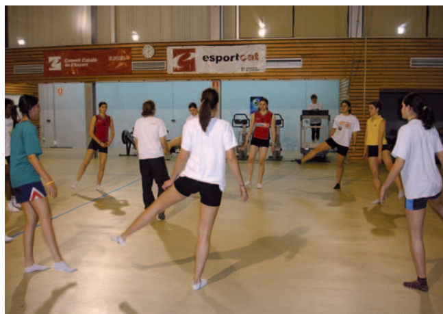
Posició d'equilibri amb moviments de abducció.