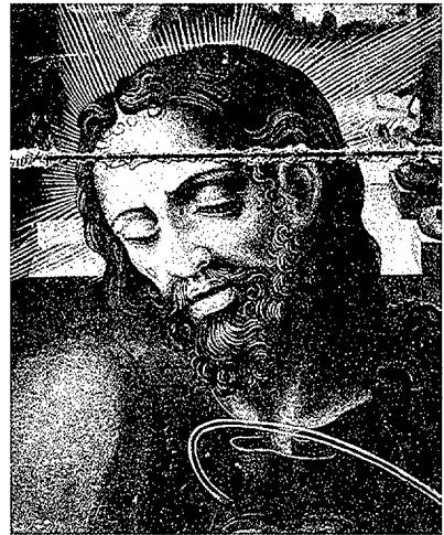
Pintures de Perris de la Roca corresponents al retaule del Corpus, de la catedral de Girona. (Fotos Arxiu Mas).