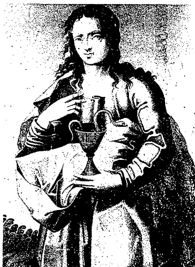
Pintures de Perris de la Roca pertanyents al retaule de la Mare de Déu del Roser, Sant Joan Baptista i Sant Joan Evangelista, de l'ex-col·legiata de Sant Feliu de Girona. (Fotos de l'autor).