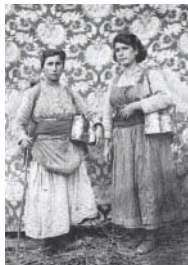
Arxiu d'Etnografia i Folklore de Catalunya. Autor desconegut.

Entitat: Centre de Cultura Contemporània Contemporània