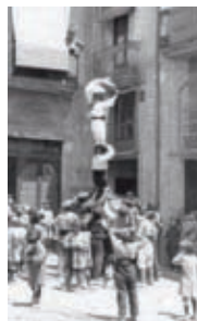
Col·lecció particular. Autor: Pere Català Pic.