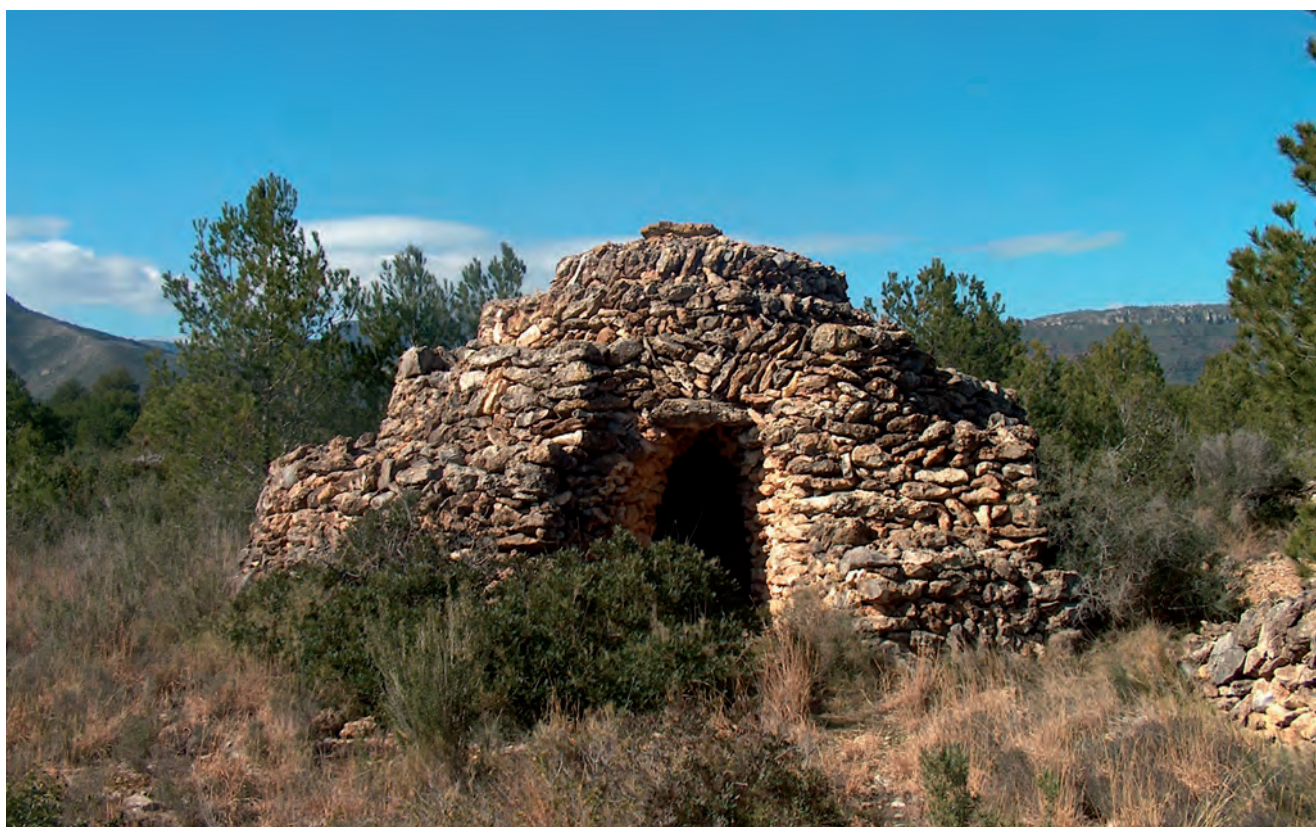
■ Barraca en espiral. La seva forma helicoidal facilita l'accés a la gran pedra cobertora que corona el sostre, que és practicable, fet que permetia l'evacuació directa del fum en cas d'encesa de foc a l'interior. La façana presenta un portal d'arc d'ametlla amb muntants arquejats i una llinda. La coberta és de cúpula i el recobriment de pedruscall.

besavis van veure construir barraques, ens fa suposar que la majoria de les de Mont-roig deu ser de mitjans o finals del segle XIX. Això també encaixa amb la teoria general sobre les barraques del Camp de Tarragona.