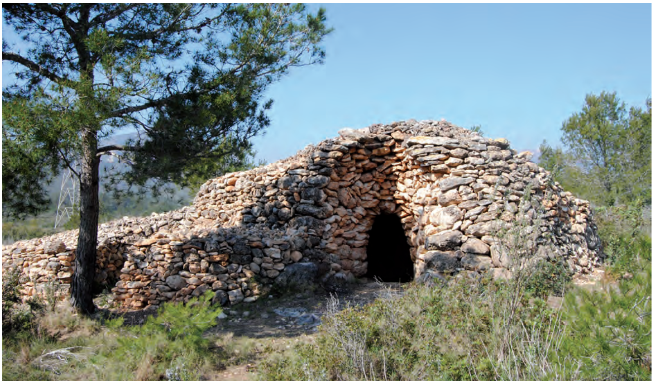
■ Exterior de la barraca del Miquel Terna. Hi destaca el portal, amb muntants arquejats acabats en arc de mig punt, que abasta tota l'amplada de les parets. Al seu interior, de planta circular, el sòl és una gran llosa de pedra que fa baixada des de l'exterior, conformant una mena d'aljub per recollir l'aigua de la pluja. La façana es perllonga, pel costat esquerre, en un cos més baix de planta semioval, que inclou una dependència de planta rectangular que en una fotografia de 1967 s'observa que estava coberta; encara ara, al fons, s'hi aprecia una mena de banquetja de pedra o menjadora.

Santa Marina és la patrona del Pratedip. Se celebra el 18 de juliol. Té una bonica ermita a uns dos quilòmetres més enllà d'aquell poble en direcció al coll de Fatxes.