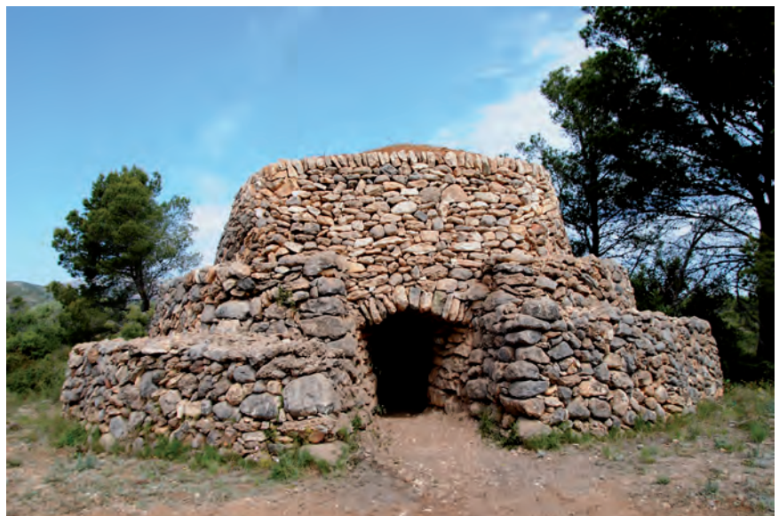
■ Vista frontal de la barraca del Jaume de la Cota. J. Gironès, a L'art de la pedra en sec a les comarques de Tarragona , l'anomena la «catedral» de les construccions rurals obrades amb pedra seca.

Per permetre la vida de les persones, les barraques i les cabanes necessitaven uns complements gairebé imprescindibles, algun dels quals també es bastien amb pedra. Són els armaris i les neveres, que se situaven a la part més fresca de les construccions, on es podien deixar els queviures amb un mínim de condicions ambientals. També els animals