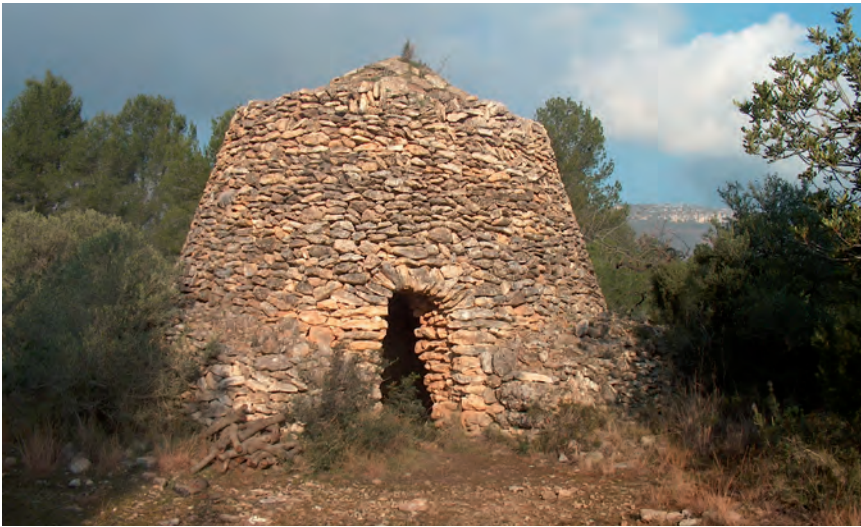
■ Barraca dels Comuns del Pellicer. Aquesta barraca acabada en punxa destaca per la tècnica emprada en la seva construcció, consistent en el possible reompliment de l'interior amb branques d'arbres per tal d'anar guanyant altura. L'interior és de planta circular i s'hi accedeix per un portal força alt, de muntants verticals i arc pla. La coberta és de terra i grans lloses.

barraques seleccionades són les conegudes com barraca dels lleris, barraca en espiral, barraca del Miquel Terna, barraca dels Comuns del Pellicer i barraca del Jaume de la Cota.