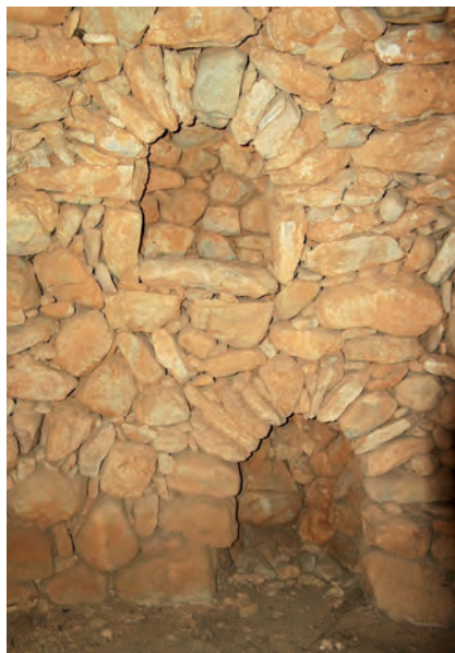
■ El gruix de les parets permetia obrir-hi armaris que servien per guardar estris del camp o per protegir els aliments de l'acció de les bèsties. A la imatge, dues fornícules —a dalt un armari i a baix un cocó— de la barraca del Jaume de la Cota.