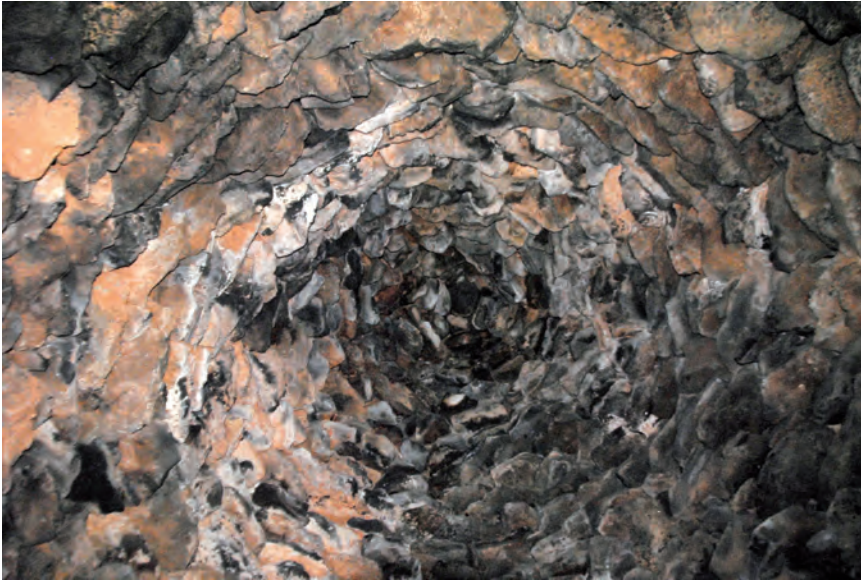
■ La coberta de la cabana dels Comuns del Pellicer arrenca amb falsa cúpula i acaba en cúpula.

tera, desnivell significatiu...). Aquesta declaració, més enllà de la protecció d'aquests elements en concret, ha de servir per posar en valor les construccions en pedra seca de tot el país, un patrimoni encara força desconegut per al gran públic i majoritàriament en perill de desaparició. ■