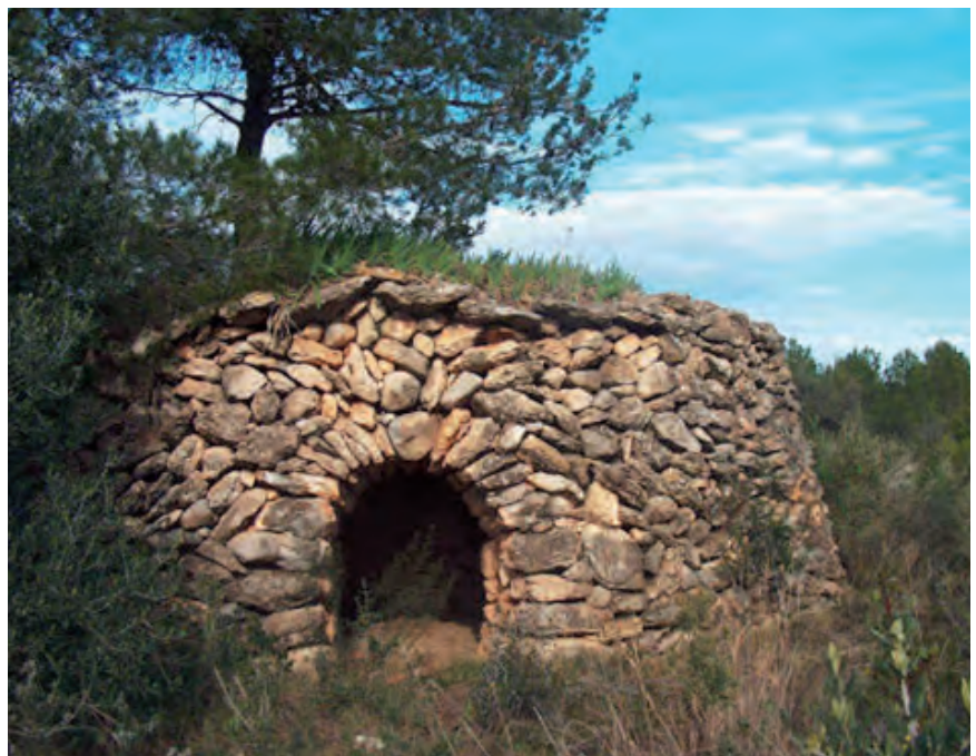
■ La barraca dels lliris, a la imatge, té a la part exterior del sostre una capa de terra i pedruscall amb lliris de Sant Josep plantats. Aquesta tècnica, molt utilitzada en barraques de sostre pla o semiplà, es feia servir perquè les fines arrels dels lliris relliguessin i aïllessin millor la coberta.

En aquelles Terres Noves i Comuns (o Palma Negra, pel nom del barranc) s'hi varen fer les rompudes per convertir els erms en terres de conreu. Aquestes rompudes consistien a desermar la terra, tallar els arbres que calia i netejar-la de matolls; o només eixer-mar-la si tan sols calia netejar-la de matolls. Sabem que per tot el Camp de Tarragona es van produir molt sovint aquestes tasques durant la segona meitat del segle XVIII. Aquestes dades dels repartiments i rompudes de finals del segle XVIII i inicis del XIX, més la inexistència de cap font oral que ens doni testimoni que els nostres avis o