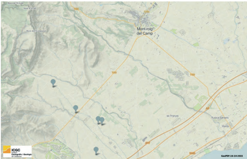
■ Mapa de situació de les barraques de Mont-roig del Camp respecte del nucli de població. ELABORACIÓ PRÒPIA (DEPARTAMENT DE CULTURA DE LA GENERALITAT DE CATALUNYA).

meteu / que els de Mont-roig tots són uns xuts / Si ens prenen les Planes estem perduts / Petits i grans tots plorarem / Marina Santa no ho permeteu.» 1