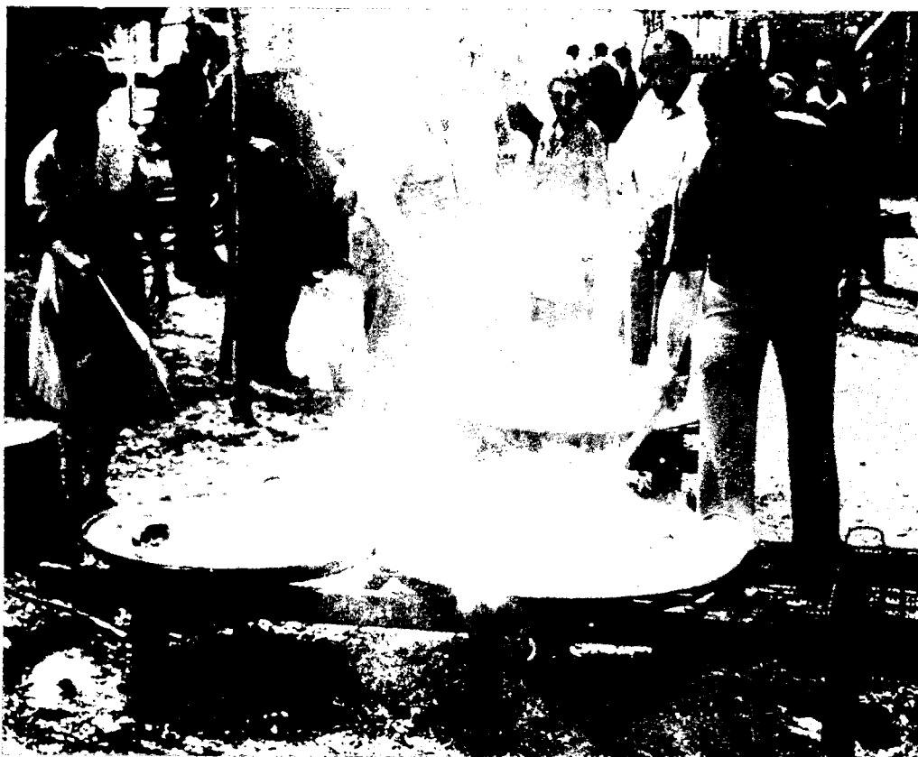
Àpats col·lectius, símbol de la importància social del fet alimentari.

Aquesta aproximació científica a l'objecte d'estudi parteix del desenvolupament metodològic i conceptual de la nutrició, disciplina de tradició positivista que estudia la fase biològica de l'alimentació. Es basa en tres fases que, en un principi, es presenten de forma diacrònica però que, en l'actualitat,