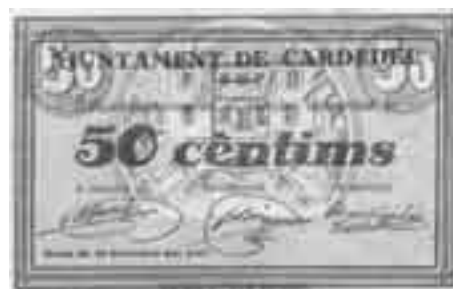
Bitllets emesos per l'Ajuntament de Cardedeu durant el mes de setembre de 1937. (Font: Museu Arxiu Tomàs Balvey de Cardedeu).