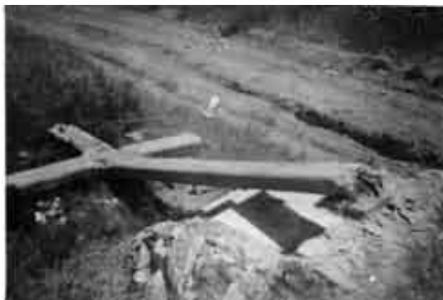
Creu de la Serreta abatuda el 27 de juliol de 1936. Aquesta creu de la missió estava situada al barri del Poble Sec de Cardedeu, a la petita carena que separa el terme de la finca de Vilalba. La data està extreta de l'anotació del dors de la fotografia: «Cardedeu: 27 de juliol de 1936. La creu de la serreta abatuda per l'antifeixisme».

la iniciativa no va prosperar i no es va reutilitzar durant tot el període bèl·lic, a diferència d'altres edificis parroquials de la comarca. 10