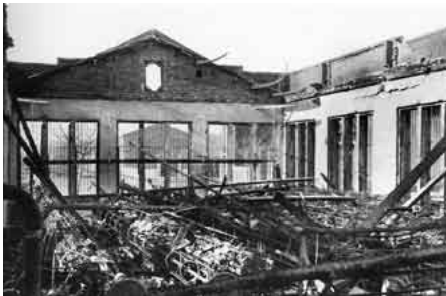
Fàbrica la Hilandera després de l'incendi provocat per elements de l'exèrcit republicà en retirada els últims dies de gener de 1939.

construir el drenatge del camp i nou refugis al voltant del camp camuflats per boscos, entre els quals destaca el més gran, a prop de les masies de can Jofre i can Morató. En dites masies va ser on es va instal·lar el comandament, el magatzem i la guàrdia. Funcionà a partir de la primavera de 1938 i va ser la base de formació del grup 28, el qual realitzà tasques de protecció i vigilància de Barcelona