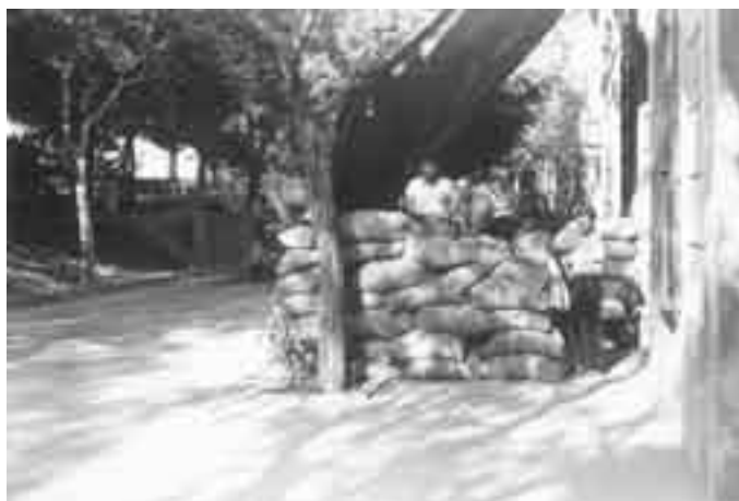
Trinxera formada principalment amb sacs de sorra davant de la casa Amat, situada a l'avinguda de la República davant de l'estació, la qual va ser requisada i utilitzada com a seu del Comitè antifeixista local.

«Dissabte, dia 18, de matí (...) eren suspeses totes les comunicacions». 4 D'aquesta manera comença a explicar els fets dels primers dies de la Guerra Civil el número especial de la revista La Gralla . Aviat la gran majoria es va assabentar per ràdio que un grup de militars havia iniciat un cop contra el Govern. El diumenge es confirmaren les temences i algunes tropes de Catalunya s'afegiren al cop d'estat. Arribaven notícies de Barcelona i la inquietud augmentà quan arribà la notícia que el cos d'artilleria de Mataró havia proclamat l'estat de guerra. «Tota la nit no cessaren els anant i els vinents per a la mobilització dels treballadors locals i de la comarca per a fer front a la rebel·lió militar». 5 Gràcies a un