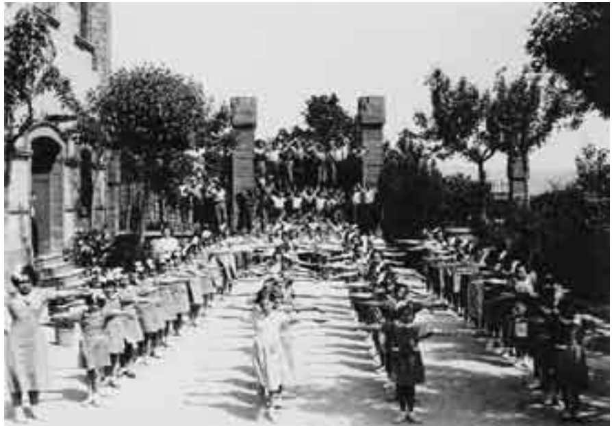
Nens i nenes del Colegio de Huérfanos de Santamarca al pati de l'antic convent de Santa Joana de Lestonnac el 1938.