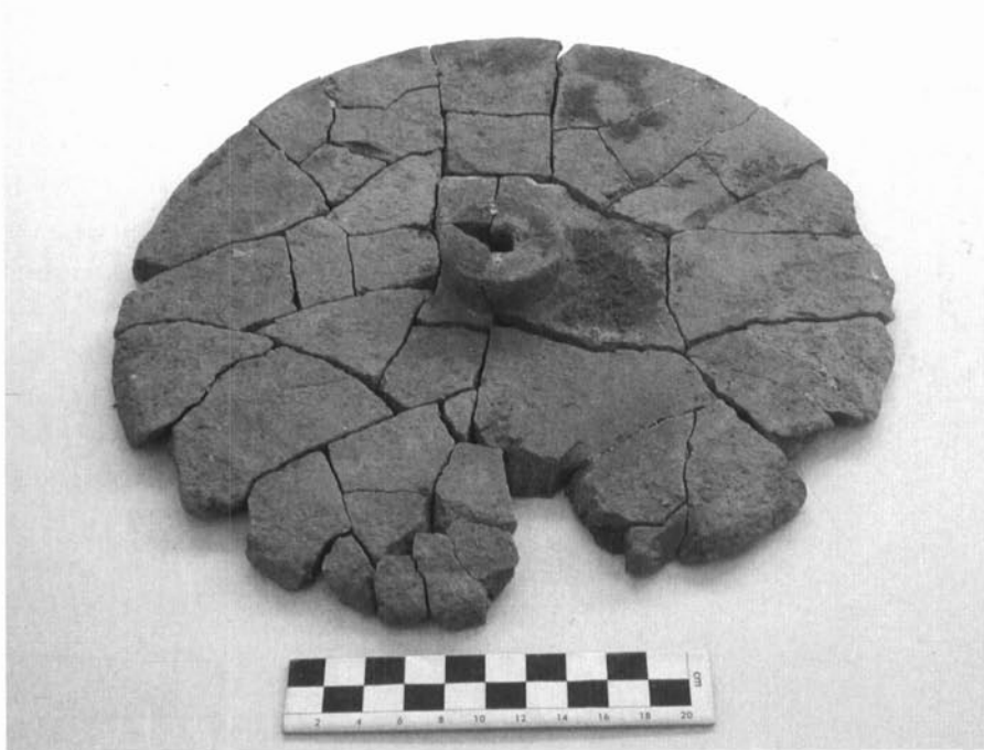
Detall de la tapadora de dolium localitzada al sector 6 de l'assentament.

La continuïtat del lloc ha de respondre a la necessitat d'un centre administratiu per organitzar i gestionar aquesta zona, que, d'altra banda, es troba molt ben situada pel que fa a la xarxa viària del moment i que deu estar en funcionament ja en plena època ibèrica, com ho demostra el miliari trobat dins del terme de Santa Eulàlia de Ronçana, a només sis quilòmetres del nucli de Caldes, i datable entre els anys 120 i 110 aC, fet que, segons diversos autors, situa la Torre Roja o el posterior nucli romà en el nus entre la via que, travessant el coll de Parpers, comunicava el Maresme amb el Vallès a través de Semproniana , la mateixa Caldes i Egara fins Ad Fines , i la via que enllaçava el Vallès amb el rerepaís fins a Ausa (Estrada i Villaronga, 1967; Miró et al. , 1998: 387; Folch et al. , 1995).