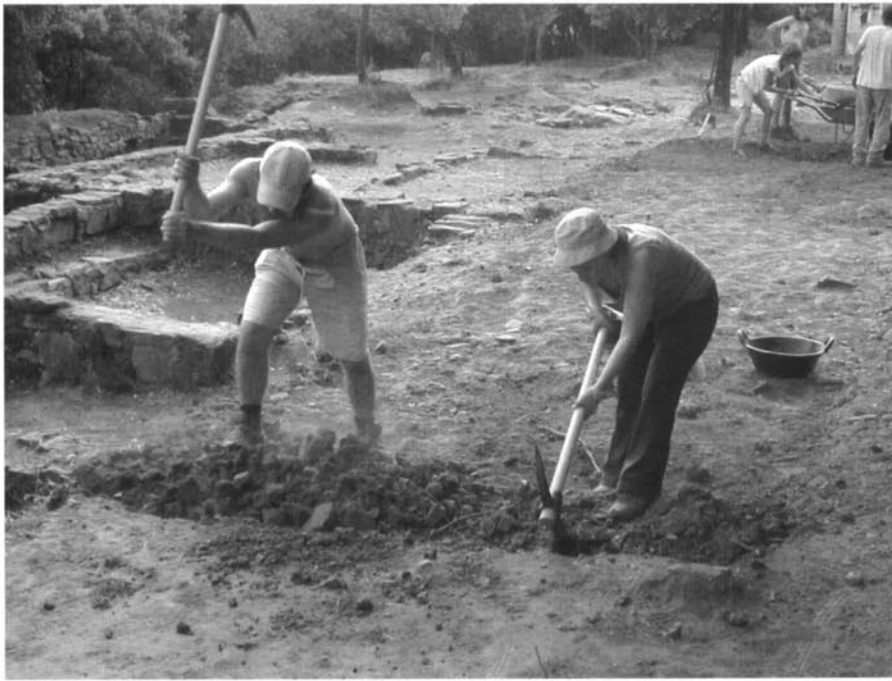
Excavació del sector nord del poblat de la Torre Roja, durant la campanya de 2004.

i 1 dC, amb una ocupació posterior al segle XI o XII) i d'algunes publicacions parcials (Miró et al. , 1984 i 1998; Miró, Revilla, 1989; Monleón et al. , 1991; Monleón, Saula, 1992). Per tots aquests factors podem considerar que els resultats d'aquesta fase han constituït la base sobre la qual hem fonamentat la recerca.