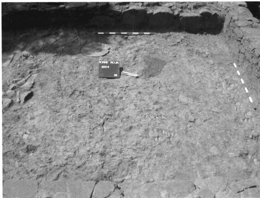
Llar localitzada durant l'excavació de l'interior del sector 6.

Els treballs d'excavació del sector 6 ens han permès delimitar inicialment un gran recinte rectangular (8m x 3,5m), tot i que es pot entreveure una possible compartimentació en dos àmbits habitacionals més petits. Cal matisar que aquest sector encara es troba en procés d'excavació i resta, per tant, inacabat. Els treballs d'excavació han permès documentar dos primers estrats d'abocament que cobrien la totalitat del sector 6, que segons els materials d'importació exhumats (campanianes B i del grup de la B) es datarien entre mitjan segle II aC i mitjan segle I aC. Aquests estrats es trobaven retallats per una tomba (TB 17), de cronologia incerta, que pertany a la necròpolis que s'estén al sud d'aquesta i