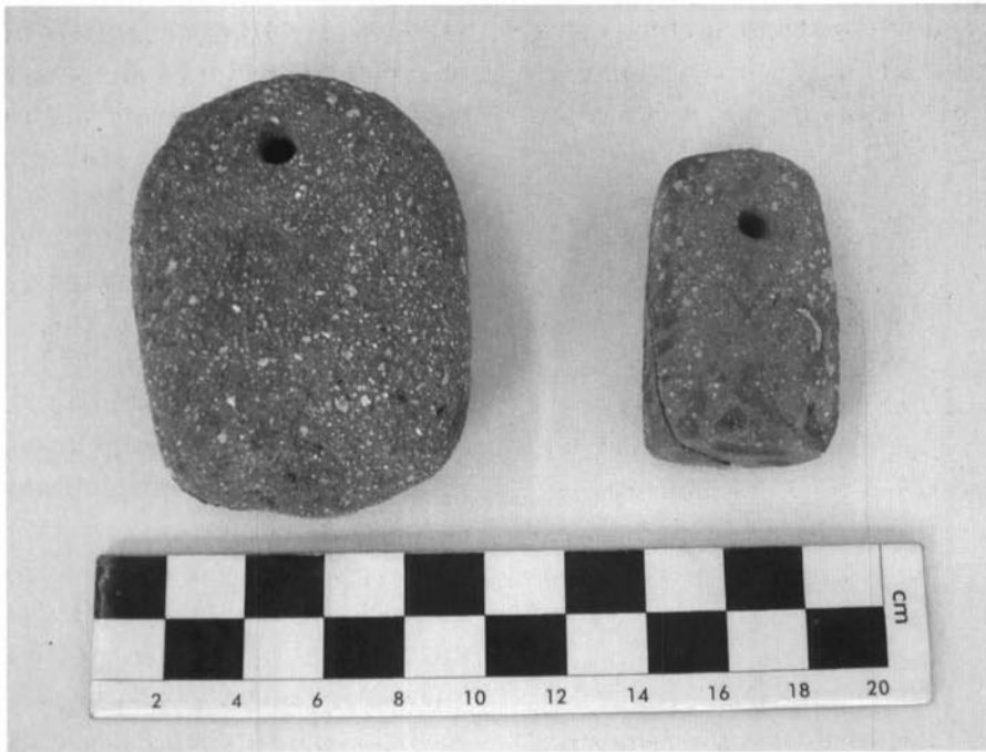
Detall dels pondera apareguts durant la intervenció.

Sobre això, dos matisos que cal fer són: en primer lloc, insistir que aquest canvi de soca-rel que estem comentant no va suposar la definitiva amortització de tots els antics nuclis de poder, ans al contrari: alguns poblats foren mantinguts i potenciats i van perdurar fins a la meitat o el final del segle I aC amb una vitalitat gens menyspreable. En segon lloc, cal parlar, encara que sigui mínimament, de la materialització arqueològica d'aquesta colonització de la plana a partir de la segona meitat del segle II aC i posar-la en relació amb les evidències de què disposem en la nostra àrea d'estudi.