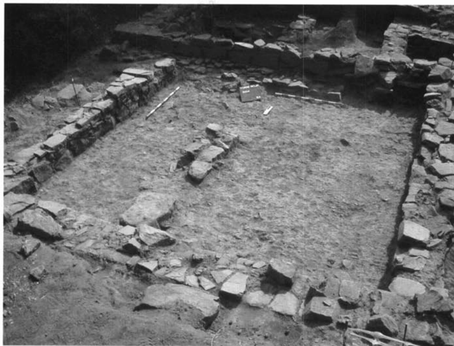
Procés d'excavació a l'interior del sector 1, on s'observen diverses fases constructives.

Aquesta primera fase d'hàbitat queda constatada per la presència d'un possible carrer ibèric (MR 22 i 51), el qual es documenta a la part central del jaciment, i que enguany es va procedir a excavar parcialment dins del sector 3. Part dels materials ceràmics associats a aquests nivells