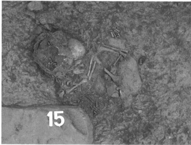
Detall de la inhumació infantil localitzada al sector 3.

La distribució interna es resumeix en un gran espai amb un paviment de terra piconada ben conservat i sense murs de separació o subdivisió en tota l'àrea i, a banda i banda, dos bancs de pedra (BQ 48-50) paral·lels a les parets llargues de l'habitació, que indiquen molt probablement el seu ús com a espai de reunió de la comunitat que hi vivia. El caràcter preeminent d'aquest espai es confirma amb la documentació de dos enterraments perinatals (el segon en un estat de conservació bastant bo) localitzats en els nivells de fundació d'aquest moment.