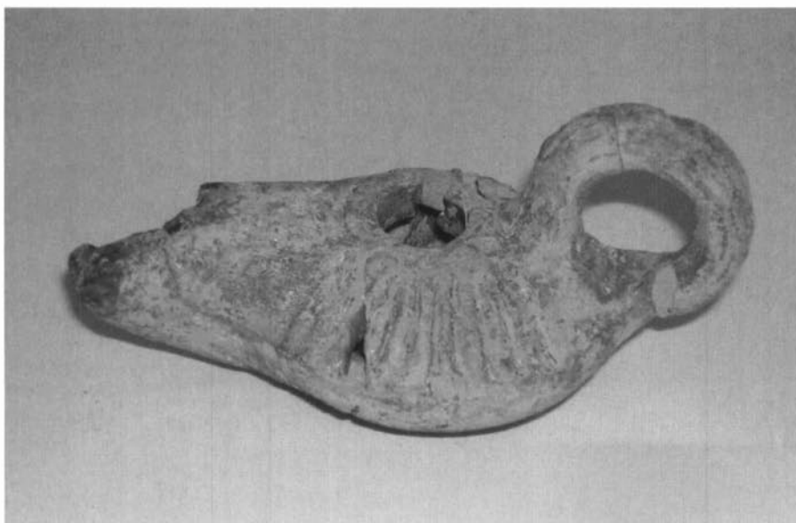
Detall d'una lucerna apareguda durant la intervenció.

Villaronga, 1967; Miró et al. , 1998; Sanmartí, 1993).