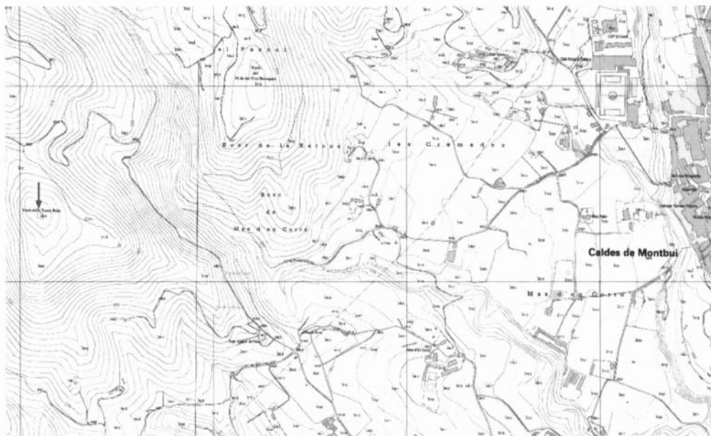
Situació del poblat de la Torre Roja, entre els termes municipals de Caldes de Montbui i Sentmenat.

Aquestes intervencions van posar al descobert «...dos habitaciones de planta rectangular y una zona en la que se supone se asentaba la