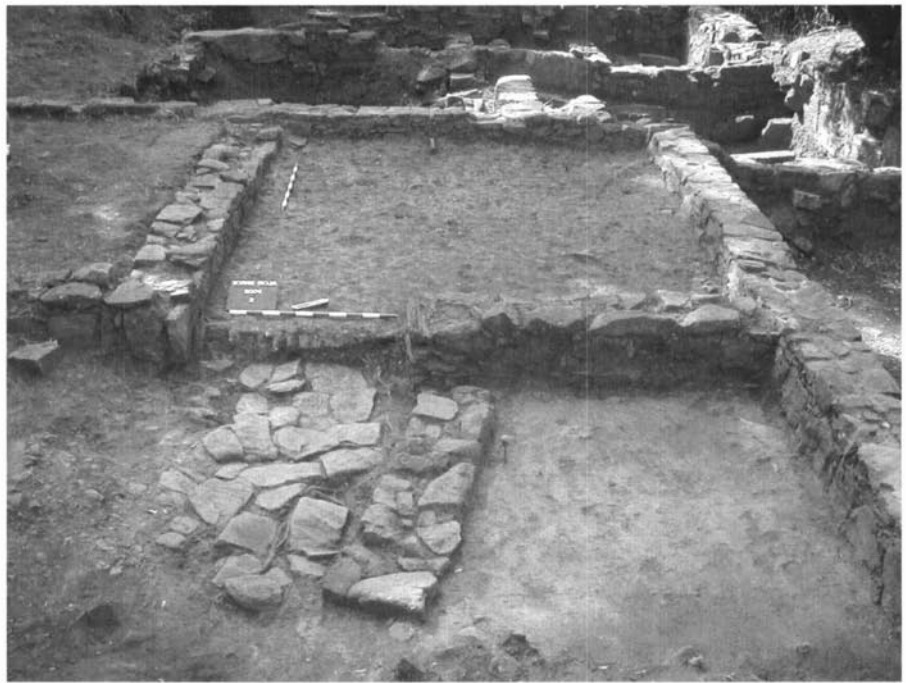
Excavació del sector 3, on es poden observar les diferents fases constructives.

Pel que fa a la cronologia d'aquesta ocupació, els testimonis més antics de què disposem, en el cas de la Torre Roja, corresponen a estrats amb materials datables al segle v aC, tal com passa