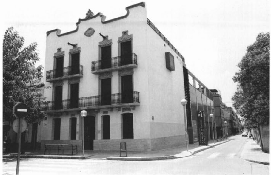
Façana del Museu Municipal Joan Abelló, de Mollet del Vallès.

La superfície total és de 1.400 m 2 , perquè s'ha ampliat la construcció a tot el pati posterior de la finca. La façana lateral dona al carrer d'Àngel Guimerà i la posterior, al carrer de Lluís Duran. El públic accedeix al Museu pel