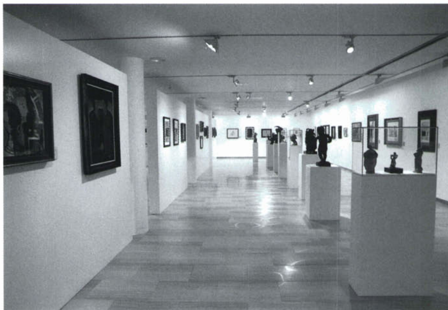
Vista del primer pis, on hi ha l'exposició «La mirada de l'artista. Cinc visions», que mostra una part de la col·lecció permanent.

Cada mirada té la seva pròpia visió que abasta un espai de temps. La intenció és mostrar la mirada de l'artista a través d'un recorregut que incorpora una lec-