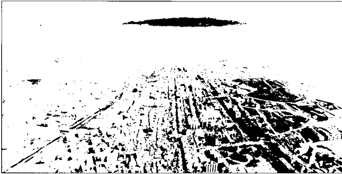
El creixement de les poblacions ha configurat algunes conurbacions de dimensions significatives a la comarca (a la foto, part de Granollers, les Franqueses i Canovelles).

Entre els diversos sectors dels serveis, cal destacar la presència del comerç i les reparacions, que concentra gaire bé la meitat de la població ocupada dels serveis. Territorialment, la distribució comercial es concentra de manera bastant marcada a Granollers, que és l'únic centre comarcal amb una forta especialització comercial. Resta Mollet a força distància. No obstant això, en els darrers anys s'ha produït una certa consolidació de diversos nuclis subcomarcals —per exemple, Sant Celoni o la Garriga—, com a nuclis d'atracció comercial, i aquests comencen a disposar d'una oferta força àmplia (taula 7). Aquestes transformacions es produeixen en bona part com a producte dels nous canvis de localització poblacional, i la seva potencialitat depèn en bona part —més que de la competència amb les grans superfícies— del tipus de demanda que s'acabi configurant en els seus entorns.