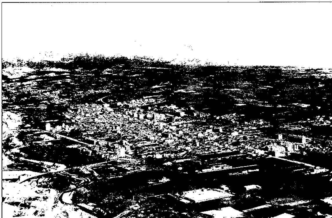
Perspectiva de Granollers a principis dels anys setanta.

s'ha alentit, malgrat que en termes comparatius quant a altres comarques catalanes, ha estat força important (Homs, 1992). El creixement dels darrers anys no ha estat provocat directament per les noves activitats econòmiques, sinó que en la seva major part ha estat fruit de la redistribució del poblament dins la regió metropolitana, que ha produït transvasaments de les zones més denses a altres menys densificades. En tot cas, aquest nou creixement sí que pot induir o potenciar noves activitats econòmiques, especialment en el camp dels serveis, en crear una nova demanda. A més, la distribució territorial del nou poblament es distinta i es concentra menys al sud de la comarca, i impulsa el creixement de municipis petits i mitjans de tota la comarca (2) . Així, per exemple, el pes en la població comarcal dels municipis esmentats anteriorment s'ha reduït l'any 1991 fins al 53,9%.