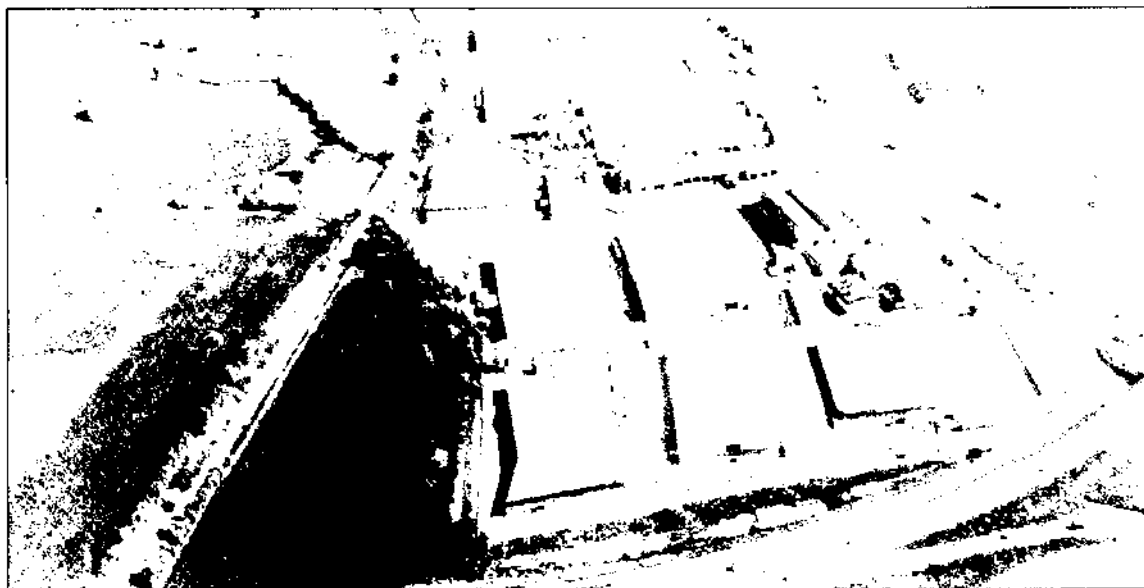
La regressió de les activitats agràries ha estat una constant enfront de l'expansió industrial.