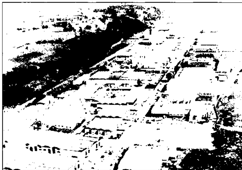
L'oferta de sòl industrial ha estat una de les bases de l'expansió econòmica de la comarca des dels anys setanta.

En primer lloc, la proximitat a Barcelona i l'existència de sòl industrial abundant, incentivaren la instal·lació d'indústries foranes a la comarca —especialment a la zona sud—, tant indústries de nova creació que buscaven una localització dins l'entorn metropolità de Barcelona, com d'empreses ja existents que es traslladaven des de les zones més congestionades de Barcelona, a causa de la necessitat d'ampliar les instal·lacions, reduir les despeses salarials o bé limitar la conflictivitat laboral.