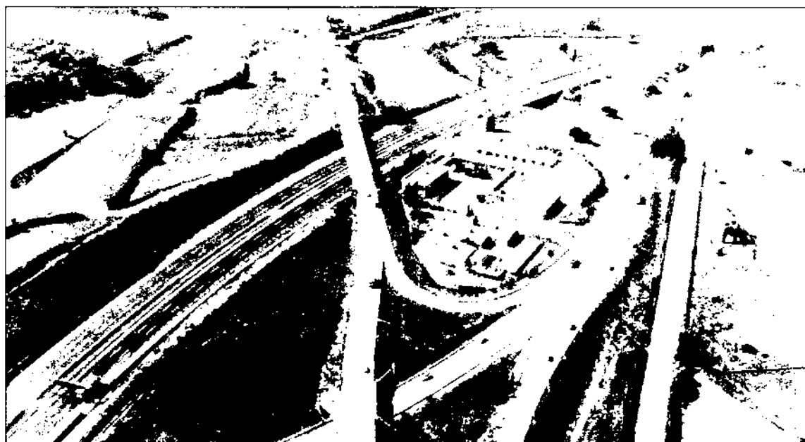
La xarxa viària que travessa la comarca és un dels principals atractius de localització que té el Vallès Oriental.

Estudis recents sobre la dinàmica interna de la regió metropolitana, basats en l'anàlisi dels desplaçaments diaris, mostren l'existència de formes d'atracció distintes quant al nucli barcelonès, que en el seu conjunt conformen la «ciutat» efectiva (Esteban, 1990). Així, apareix un primer nucli, anomenat també primera corona, en una àrea de 10-15 km de radi a l'entorn de Barcelona, amb relacions molt intenses amb el centre i que forma gairebé una extensa conurbació. Pel que fa al Vallès Oriental, alguns autors consideren que Mollet i els seus entorns ja formen part d'aquesta primera corona (Clusa, 1992). Una segona corona, que s'estén fins a un radi d'uns 35 km a l'entorn de Barcelona, configura la resta de l'aglomeració metropolitana. En aquesta corona, existeixen diverses conurbacions que actuen com a subsistemes metropolitans, i que generen una atracció pròpia al seu voltant: Martorell, Terrassa, Sabadell, Mataró i Granollers són els nuclis més destacats. Tots aquests nuclis mantenen unes intenses relacions amb el centre barcelonès, però alhora també estableixen vincles importants entre elles (Baró et al., 1991).