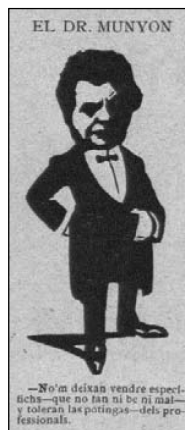
Fig. 2. ¡Cu-Cut! Any 01, Núm. 27 (3 juliol 1902). p. 444. 3