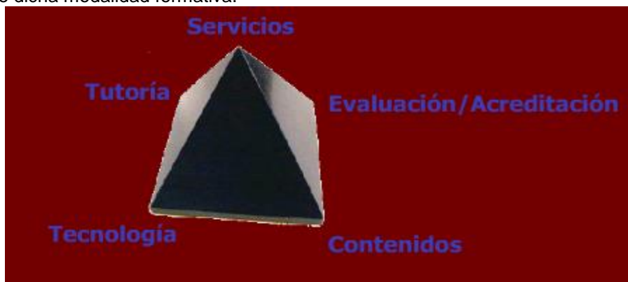
(García Peñalvo, 2005)

Pero al plantear un sistema de formación on line también es necesario tener presente la pirámide de dicha modalidad formativa.